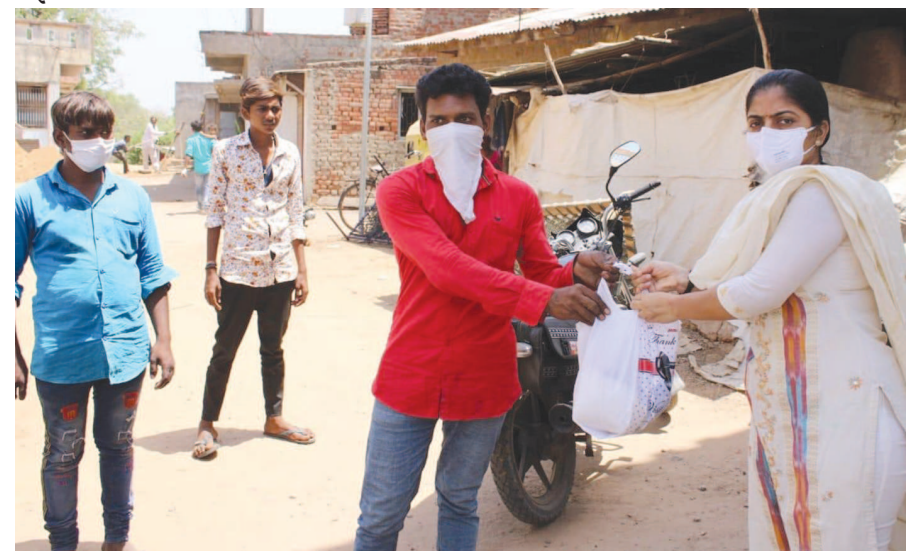
જરૂરિયાતમંદ પરિવારોને પોતાના હસ્તક રાશનની કીટોનું વિતરણ કર્યું.

ગાંધીનગર, તા. ૨૭ મગોડી ગામમાં ઘણા જરૂરિયાતમંદ પરિવારો છે જેમને જરૂરિયાતમંદોને ભોજનની વ્યવસ્થા થાય છે કે નહિ તેમ પુછવું ત્યારે ગામના સરપંચ દ્વારા મેયરને રીતે સ્વખર્ચે રાશનની કીટો બનાવડાવી અને રિવારે સવારે મેયરે પોતે ગામમાં આવી તમામ