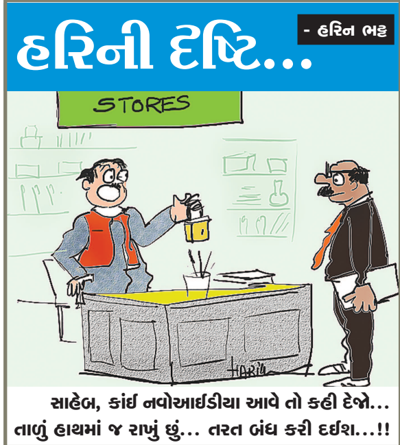
સાહેબ, કાંઈ નવોગ્રાઈડિયા આવે તો કહી દેજો... તાળું હાથમાં જ રાખું છું... તરત બંધ કરી દઈશ...!!

લોકડાઉનની સ્થિતિ વચ્ચે નાગરીકોને તકલીફનો સામનો ન કરવો પરંતુ તે માટે જીવન જરૂરીયાતની ચીજવસ્તુઓની દુકાન ખુલ્લી હોય છે. ત્યારે ખાદ્યપદાર્થોની ચીજવસ્તુઓનું વેચાણ કરતા વેપારીઓને પણ સવાર સાંજ દુકાન ખોલવાનો અને બંધ કરવા માટે સમય નિયત કરાયો છે. જેથી નાગરીકો ટોળા એકઠા ન થાય અને સોશિયલ ડિસ્ટન્સ જળવાય. ત્યારે કુડાસણ ખાતે સરદાર ચોક નજીક એક દુકાનદાર દુકાનની અંદર તો સામાન ખીચોખીચ ભરેલો છે, તેમ છતાં દુકાનની બહાર મોટો પથારો લાંબો કરીને બેસી રહે છે. દુકાન ખુલ્લી રહે તે માટેનો કોઈ સમય નિયત કરેલો નથી. તો બીજીતરફ આ દુકાન ખાતે ખરીદી કરવા માટે આવતા નાગરીકોમાં સોશિયલ ડિસ્ટન્સ જળવાતું નથી તેવી ફરીયાદો પણ ઉઠવા પામી છે. ત્યારે સ્થાનિક નાગરીકો વેપારીને આ અંગે સમજાવવા માટે જતા ગતરોજ સાંજના સુમારે હોબાળો થયો હતો. સ્થાનિક નાગરીકોને વેપારી મહાશય ગાંઠતા નથી તેમ લાગી રહ્યું છે. ત્યારે વેપારી દ્વારા દુકાન બહાર મોટો પથારો કરાયો છે તે દુર કરવામાં આવે અને કોરોનાની મહામારીને પગલે વેપારી દ્વારા સલામતી-સાવચેતીનું ધ્યાન રાખવામાં આવે તેવી સ્થાનિક નાગરીકોની લાગણી અને માંગણી છે.