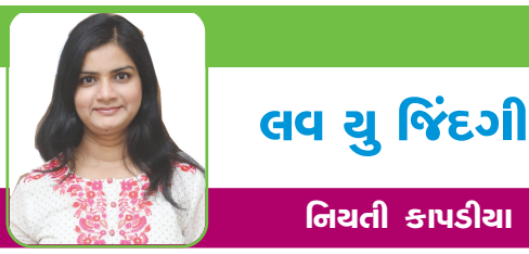
લવ યુ જિંદગી

એમની હોસ્પિટલ બીજા ડોક્ટર અને સ્ટાફને ભરોશે છોડી એ જાતે, સ્વેચ્છાએ સિવિલ હોસ્પિટલમાં ખાસ ઊભા કરાયેલા કોરોના વોર્ડ, કોવિડ હોસ્પિટલમાં જોડાઈ ગયા છે. રોજ રોજ કોરોનાની ભયાનક અસર હેઠળ આવી ગયેલા લોકોની સારવારમાં કરવી, એમને તપાસવા, એમને સાંત્વના આપવી સરળ કામ નથી. નજર સામે કોઈ માણસને મરતું જોવું, છેલ્લી ઘડી સુધી જેને બચાવવા પ્રયત્ન કર્યો હોય એ માણસની છેલ્લા શ્વાસ લેતી વખતની આંખોનો સામનો કરવો કોઈ કાયા પોચા માણસનું કામ નથી! એની આંખો સતત આજીજી કરતી હોય કે ડોક્ટર મને બચાવી લો... ડોક્ટર પૂરો પ્રયત્ન કરે જ છે છતાં ક્યારેક હારી જાય ત્યારે એનેય એના ગળે કોળિયો ઉતારવું મુશ્કેલ લાગે છે! એક દર્દી પાસેથી નિરાશ થયેલા એ યોદ્ધાને હાર માનવાનું પોસાય એવું હોતું જ નથી. દર્દીઓની લાંબી લાઈન લાગી છે. એને પોતાને શ્વાસ લેવાની પણ કુરસત નથી ત્યાં નિરાશાની વાતો કેવી? તરત બીજા દર્દીની સારવાર માટે