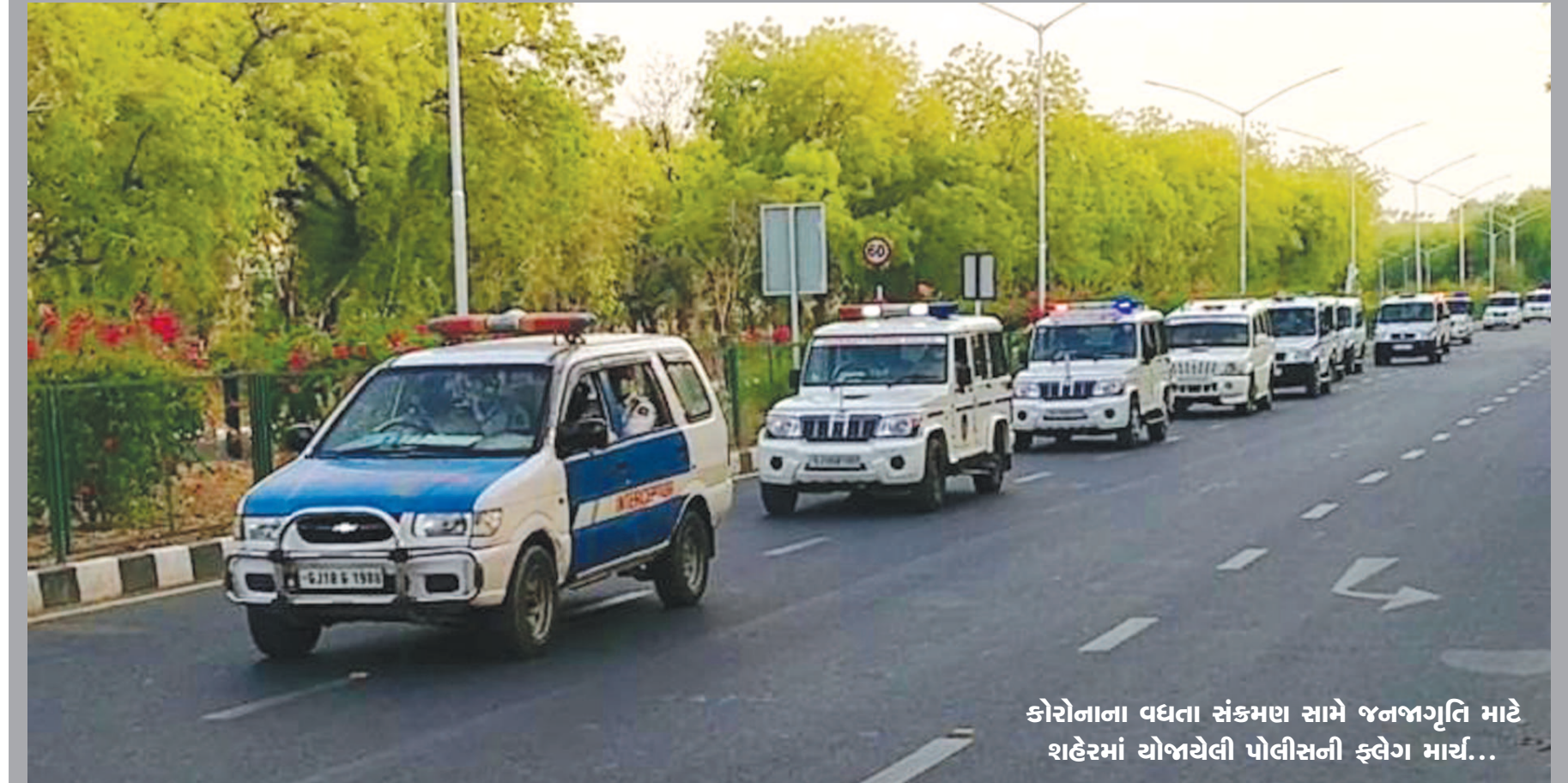
કોરોનાના વધતા સંક્રમણ સામે જનજાગૃતિ માટે શહેરમાં યોજાયેલી પોલીસની ફ્લેગ માર્ચ...

કવોરોન્ટાઈન સેન્ટરમાં નિમણુંક આપવામાં આવેલ હતી. તંત્ર દ્વારા આ તબીબના ઘરને સેનીટાઈઝ કરવા ઉપરાંત ધરાઈ હોવાનું જાણવા મળેલ છે. તે. ૩ માંથી આ પાંચમો કેસ કોરોનાનો સામે આવતાં તંત્રની ચિંતામાં વધારો થવા પામ્યો છે.