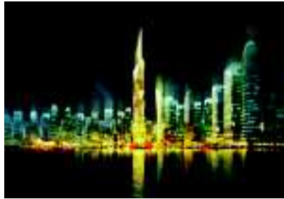
કાયનાન્સ ટેક (ગિફ્ટ) સિટીની ઈમારતોનું ધોવાણ ન થાય તે હેતુથી

(વિશેષ પ્રતિનિધિ) ગાંધીનગર, તા.૫ ગુજરાત ઈન્ટરનેશનલ