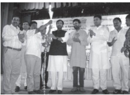
યુવકોની ભૂમિકા અને નહેરૂ યુવા કેન્દ્રના કાર્યક્રમોની જાણકારીથી વાકેફ કરવા એ હતો, સંમેલનમાં રાજ્યભરના વિવિધ જિલ્લાઓમાંથી

ગાંધીનગર, તા. ૮ ભારત દેશ એ યુવાનોનો દેશ છે, તેમને રાષ્ટ્ર નિર્માણ કાર્યક્રમ માટે રચનાત્મક દિશા આપવી જોઈએ. અમદાવાદ ખાતે શનિવારે સવારે રોડ ટ્રાન્સપોર્ટ અને નેશનલ હાઈવે વિભાગના કેન્દ્રીય મંત્રી યુવારભાઈ ચૌધરીએ આ શબ્દો ઉચ્ચાર્યા હતા. ટાઉનહોલ ખાતે નહેરૂ યુવા કેન્દ્ર, ગાંધીનગર અને અમદાવાદ આયોજિત યુવા સંમેલનમાં ઉદ્ઘાટક તરીકે પ્રવચન કરતાં તેમણે આ શબ્દોનું ઉચ્ચારણ કર્યું હતું. આ યુવા સંમેલનનો મુખ્ય ઉદ્દેશ રાષ્ટ્ર ઘડતરમાં