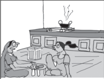
તમારા ભાઈ સાથે મેં છુટાછેડા લઈ લીધા એટલે આ જાતે કામ કરવું પડે છે, બાકી સંઘણા છલના દિવસે એ મને એટલી મદદ કરાવતા કે વાત ન પૂછે !