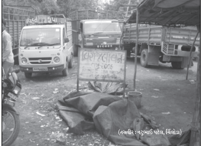
વિશેષ દિનની યાદમાં યોજાતા વૃક્ષારોપણના કાર્યક્રમોની જાહેરાત જોરશોરથી થતી હોય છે કરંતુ એકવાર કાર્યક્રમ પૂર્ણ થઈ ગયા પછી વૃક્ષોની જાળવણી યોગ્ય રીતે થાય છે કે નહીં તેની કોઈ કાળજી લેવાતી નથી. ચિલોડા સર્કલ નજીક ૨૦૦૭માં શહીદોની સ્મૃતિ તથા ૯મી ઓગસ્ટના લોકક્રાંતિ દિનની ઉજવણીના ભાગરૂપે વીરાંજલિ વન ઉભું કરી મોટા પાયે વૃક્ષારોપણ થયું હતું. કાળજી ન લેવાતા રોપાઓ મુરઝાઈ ગયા અને તે જમીન પર ગેરકાયદે દબાણ થઈ ગયું. તસ્વીરમાં વીરાંજલિ વનના પાટીયાની પાછળ વાડનોનો ખડકો જોવા મળી રહ્યો છે.

જણાવ્યા અનુસાર શહેરના ૯૯ ટકા લોકોને મિલકત વેરાની આકારણી વિરૂધ્ધ વાંધો અને રોષ છે. છેલ્લા બે વર્ષમાં ઘણા ખરા મકાનોના બાંધકામમાં ફેરફાર થઈ ગયો છે. જ્યારે રહેણાંક વિસ્તારમાં ઘણા મકાનોનો ઉપયોગ વાણિજ્ય હેતુ માટે થાય છે ત્યારે આવા મકાનોની આકારણી રહેણાંક મકાન તરીકે દર્શાવાઈ છે. આ સ્થિતિના લીધે મહાનગરપાલિકાને પણ વર્ષે લાખો રૂપિયાની ખોટ જાટ છે. પરિષદ દ્વારા શહેરના મકાનોની પુનઃ આકારણી વૈજ્ઞાનિક ઢબે નિયત મુજબ કરવા પણ રજૂઆત કરવામાં આવી છે.