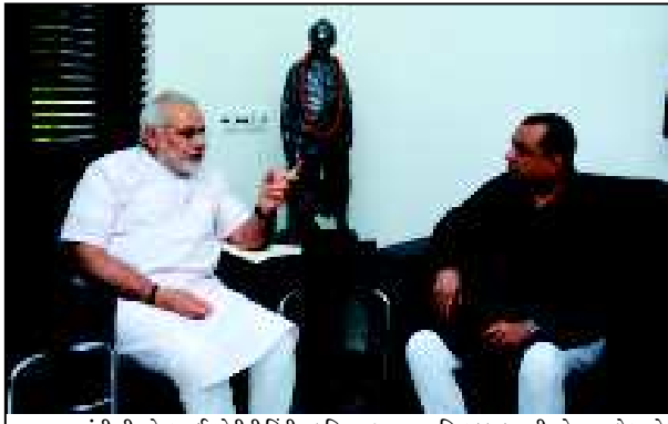
મુખ્યમંત્રી શ્રી નરેન્દ્રભાઈ મોદીની હિંદી ચલચિત્ર જગતના સુપ્રસિદ્ધ કલાકાર શ્રી પરેશ રાવલે આજે ગાંધીનગરમાં સોજન્ય મુલાકાત લીધી હતી. ગુજરાતની સર્વાંગીણ પ્રગતિથી પ્રભાવિત થયેલા શ્રી પરેશ રાવલે મુખ્ય મંત્રીશ્રીના નેતૃત્વ હેઠળ ગુજરાત વિકાસની નવી ઉંચાઈઓ સર કરશે એવો વિશ્વાસ દર્શાવ્યો હતો.

છે. વહેલી સવારે શહેરના સમગ્ર મસ્જીદોમાં વિશેષ નમાઝ અને ધાર્મિક કાર્યક્રમો થી ચલકાટ હવે જોવા મળી રહે છે. હવે રમઝાન ઈદ નજીક હોવાથી તેની ઉજવણીની તૈયારીઓ પણ પુરજોશમાં ચાલી રહી છે. મસ્જીદો અને ઘરો પર રોશની કરવામાં આવી રહી છે. રાતે તો મસ્જીદોની રોશનીનો નાજરો જોવા જેવો હોય છે. ગાંધીનગરમાં સેક્ટર-૨૧, સેક્ટર-૨૮ ઉપરાંત સેક્ટર-૫ની મસ્જીદોમાં પણ રોશની કરવામાં આવી રહી છે. બજારોમાં પણ ઈદની પહેલો ગયો છે. ટેર ટેર તીલાવને કુરાન, તરાવીહની નમાઝ ઉપરાંત વિશેષ નમાઝનો દોર ચાલી રહ્યો છે. મસ્જીદોમાં આખો દિવસ કોઈને કોઈ વિશેષ કાર્યક્રમો યોજાતા રહે