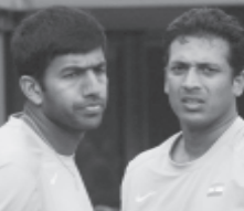
હવે મેદાનમાં ઉતરશે. બીજા સપ્ટેમ્બર પહેલા ફરી એકવાર ચક્રાવળી કરવામાં આવશે. વિયાન્ડર પેસ એમેરિકામાં વર્લ્ડ ટીમ ટેનિસ