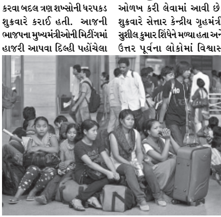
સેત્તારે કહ્યું હતું કે પાંચ લોકોની ધરપકડ કરવામાં આવી છે. અફવા ફેલાવનાર અન્ય ચાર લોકોની

જગાવવા લેવામાં આવેલા પગલાં અંગે માહિતી આપી હતી. બેંગલોરમાં ઉત્તર પૂર્વના ૨૪૦૦૦ લોકો રહે છે. જ્યારે બીજા ૧૦૦૦૦ લોકો કબ્લાટના અન્ય ભાગોમાં રહે છે. આ વસ્તી પૈકી હજારોની સંખ્યામાં વિદ્યાર્થીઓ પણ છે. જમોટા ભાગના નોકરીયાત લોકો હોટલો, બ્યુટી પાર્લરો અને સિક્યુરિટી ગાર્ડમાં નોકરી કરી રહ્યા છે. કબ્લાટમાંથી હકાલપટ્ટીને રોકવાના હેતુસર આસામના બે પ્રધાનો શુક્રવારે ગુવાહાટીથી બેંગલોર પહોંચ્યા હતા. આ લોકોએ શહેર છોડવાની તૈયારી કરી રહેલા સેંકડો લોકો સાથે વાતચીત કરી હતી. જોકે તેમના પ્રયાસો સફળ રહેવા નથી. શહેરના તમામ સંવેદનશીલ વિસ્તારોમાં સુરક્ષા મજબૂત કરવામાં આવી છે. ઉત્તર પૂર્વના લોકો જ્યાં રહે છે ત્યાં પેટ્રોલિંગની પ્રવૃત્તિ તીવ્ર બનાવવામાં આવી છે.