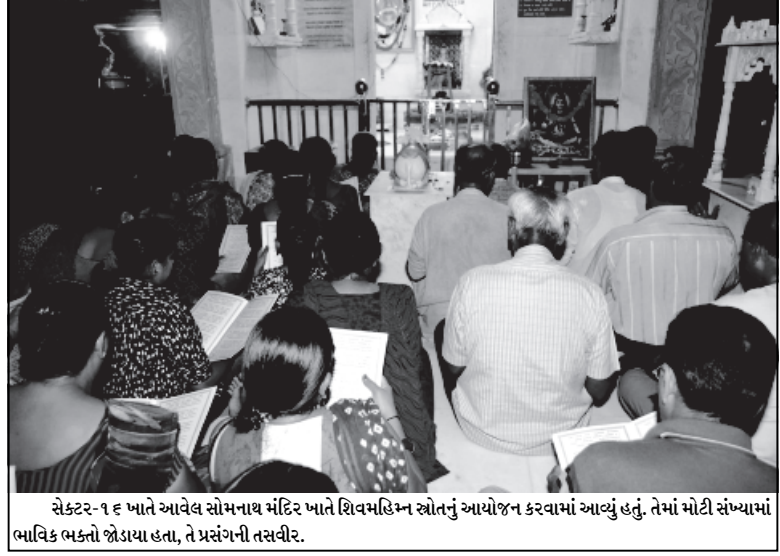
સેક્ટર-૧૬ ખાતે આવેલ સોમનાથ મંદિર ખાતે શિવમહિમ્ન સોનનું આયોજન કરવામાં આવ્યું હતું. તેમાં મોટી સંખ્યામાં ભાવિક ભક્તો જોડાયા હતા, તે પ્રસંગની તસવીર.

ગાંધીનગર જિલ્લામાં વિકાસની વણથંભી વિકાસ યાત્રા દરમ્યાન ૧૬૭ જેટલા કામોનું લોકાર્પણ અને કામનો પ્રારંભ કરવામાં આવનાર છે. આ વખતે ગરીબ કલ્યાણ મેળામાં વિકાસનો દસકો અને વિકાસગાથાની વિશેષ વિગતો પણ રજૂ કરવા માટેનું આયોજન હાથ ધરવામાં આવ્યું હોવાનું જણવા મળેલ છે.