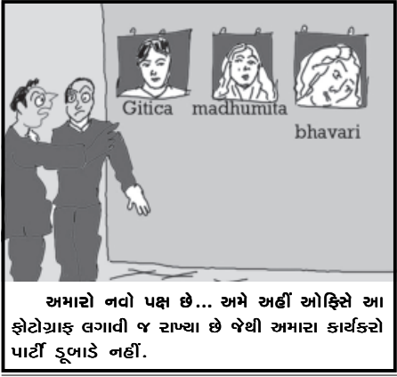
અમારો નવો પક્ષ છે... અમે અહીં ઓફિસે આ ફોટોગ્રાફ લગાવી જ રાખ્યા છે જેથી અમારા કાર્યકરો પાર્ટી ફૂલાડે નહીં.

આજે બસો બ્યાસી વણકર સમાજ તેજસ્વી વિદ્યાર્થીઓનું સન્માન કરશે ગાંધીનગર, તા. ૨૫ સમાજના તેજસ્વી તારલાઓને ગાંધીનગર વસાહતી બસો બ્યાસી વણકર સમાજ આજે આંબેડકર હોલમાં તેજસ્વી તારલાઓના સન્માન સમારોહ કાર્યક્રમનું સવારે ૧૦.૦૦ કલાકે આયોજન કરવામાં આવ્યું છે. ગાંધીનગરમાં વસતા બસો બ્યાસી વણકર સમાજના પરિવારોની સર્વે ભાઈ-બહેનોને સંસ્થાના પ્રમુખ પરિચય પુસ્તિકાનું વિમોચન તેમજ