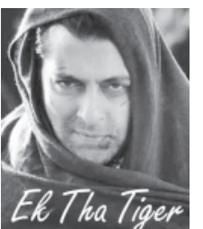
Elk Tha Tiger

મુંબઈ, તા. ૨૭ ૧૫મી ઓગસ્ટના દિવસે દેશભરમાં રજુ થયેલી એક થા ટાઈગર નામની ફિલ્મ બોક્સ ઓફિસ ઉપર ખુબ મથાવી રહી છે. આ ફિલ્મ માત્ર ૧૧ દિવસના ગાળામાં જ રેકોર્ડ ૨૧૦ કરોડની કમાણી કરી ચુકી છે અને આ ફિલ્મ હજુ પણ વધુ કમાણી કરવાના બોક્સ ઓફિસ ઉપર રેકોર્ડ સર્જે તેવી શક્યતા છે. શરૂઆતના પાંચ દિવસમાં જ આ ફિલ્મ ૧૦૦ કરોડનાં આંકડા સુધી પહોંચી ગઈ હતી. આંતરિક સુનોનું કહેવું છે કે આ ફિલ્મ ૨૦૦ કરોડનાં આંકડાને પહેલાથી જ પાર કરી ચુકી છે. બોલિવુડ સાથે સંકળાયેલા નિષ્ણાંત અને કમાણી ઉપર નજર રાખનાર તરન આદર્શે કહ્યું છે કે એક થા ટાઈગર ફિલ્મે માત્ર ૧૨ દિવસના ગાળામાં માત્ર