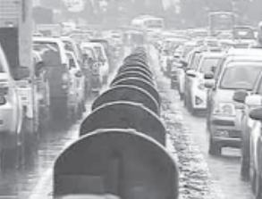
મુંબઈમાં પાણી ભરાઈ ગયા હતા

માતા, પારેલ, દાદર, પશ્ચિમ ઉપનગરીય વિસ્તારોમાં ઇંટપુણ સુધીના પાણી ભરાઈ ગયા હતા. ટ્રાફિક સિગ્નલોને પણ માટી અસર થઈ હતી. બે મુખ્ય એક્સપ્રેસ લાઈવે ઉપર પણ ટ્રાફિક સિગ્નલોને અસર થઈ હતી. સિવિક સત્તા વાળાઓ સામે નવી પડકારરૂપ સ્થિતિ ઉભી થઈ ગઈ હતી. જે વિસ્તારોમાં વધુ પાણી ભરાઈ ગયા હતા તે વિસ્તારમાંથી પાણી બહાર કાઢવા પંપનો ઉપયોગ કરવામાં આવ્યો હતો. હવામાન વિભાગે આગાહી કરી છે કે મુંબઈ, થાણે અને રાયગડ જિલ્લામાં આગામી ૩૬ કલાક દરમિયાન ભારે વરસાદ થઈ શકે છે. મહારાષ્ટ્રના અન્ય ભાગોમાં પણ અતિભારે વરસાદ થઈ શકે છે. આગામી ૨૪ કલાકમાં દક્ષિણ કોલકા અને ગોવામાં ભારે વરસાદ થયો હતો. રવિવાર સુધી મુંબઈમાં ઓગસ્ટના મહિનામાં સૌથી ઓછો વરસાદ નોંધાયો છે. મુંબઈમાં માત્ર ૨૪.૬ મીમી જેટલો વરસાદ ઓગસ્ટ મહિનામાં નોંધાયો છે.