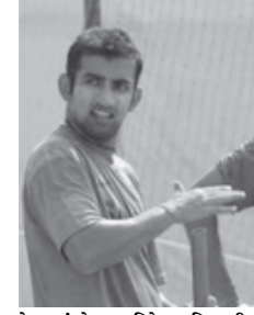
રાહુલ દ્રવિડ અને ગંભીર

દેવામાં આવ્યા છે. બીસીસીઆઈના અધિકારીએ આજે આ મુજબની માહિતી આપી હતી. રાહુલ દ્રવિડ અગાઉ રાજ્ય ગાંધી ખેલ રત્ન એવોર્ડ માટે પણ દાવેદારોમાં હતા. પરંતુ આ હતા. શાસ્ત્રીએ કહ્યું હતું કે મિટિંગ માટે કોઈ આમંત્રણ તેને મળ્યું ન હતું. અને ઉલ્લેખનીય છે કે રાહુલ દ્રવિડે આંતરરાષ્ટ્રીય ક્રિકેટમાં એક પછી એક રેકોર્ડ પોતાના નામ ઉપર કરેલા હતા. રાહુલે ૧૩૪ ટેસ્ટ મેચોમાં ૧૩૦૦૦થી વધુ રન બનાવ્યા છે. જ્યારે ૩૪૪ વન-ડેમાં ૧૧૦૦૦થી વધુ રન બનાવ્યા છે. તે આંતરરાષ્ટ્રીય ક્રિકેટમાં ૨૪૦૦૦થી વધુ રન બનાવી ચુક્યો છે. જેમાં ૩૬ ટેસ્ટ સદી અને ૧૨ વન-ડે સદીનો સમાવેશ થાય છે. બીજા બાજુ ગંભીરે પણ એક શાનદાર ક્રિકેટર તરીકે ઉભરી આવવામાં સફળતા મેળવી છે. તે પહેલાથી જ અર્જુન એવોર્ડ મેળવી ચુક્યો છે. ગયા વર્ષે વર્લ્ડ કપની ફાઈનલમાં ગંભીરે ૯૭ રન ફટકાર્યા હતા. પદ્મભૂષણ અને ભારત રત્ન અને પદ્મવિભૂષણ બાદ દેશના ત્રીજા સૌથી મોટા સન્માન તરીકે ગણવામાં આવે છે. સચિન તેન્ડુલકર એકમાત્ર એવો ક્રિકેટર છે જે પદ્મવિભૂષણ મેળવી ચુક્યો છે. જ્યારે સુનિલ ગવાસ્કર સહિતના ઘણાં ક્રિકેટર પદ્મભૂષણ મેળવી ચુક્યા છે.