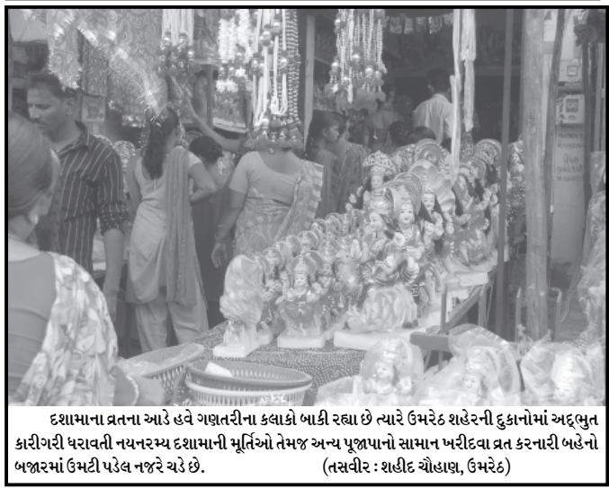
દશામાના વ્રતના આરંભે હવે ગણતરીના કલાકો બાકી રહ્યા છે ત્યારે ઉમરેઠ શહેરની દુકાનોમાં અદ્ભુત કારીગરી ધરાવતી નયનરમ્ય દશામાની મૂર્તિઓ તેમજ અન્ય પૂજાપાનો સામાન ખરીદવા વ્રત કરનારી બહેનો બજારમાં ઉમટી પડેલ નજરે ચરે છે.

ઉમરેઠ, તા. ૫ ઉપરવાસમાં વરસેલા ભારે વરસાદ અને ડેમમાંથી છોડવામાં આવેલા પાણીથી મહિસાગર નદીએ રોડ સ્વરૂપ ધારણ કરતા પૂર જેવી સ્થિતિ સર્જાઈ હતી. શનિવારે ધસમસતા પાણીના પ્રવાહે સેવાલીયા (પાલી) ગ્રામ પંચાયત તરફથી પીવાના પાણીના પ્રવાહમાં આવેલી પાર્થપ પાણીના પ્રવાહમાં તણાવા લાગી હતી. તેની જાણ પાલી પંચાયતના સભ્ય ઈરફાન સૈયદને થતાં શણગાં પછ વિલંબ કર્યા વગર ૭૦ ફૂટ ઊંચા પૂલ પરથી પાણીમાં છલાંગ લગાવીને પાણીમાં તણાતી જતી પાર્થપને પકડી સલામત જગ્યાએ લાવી ફરીથી