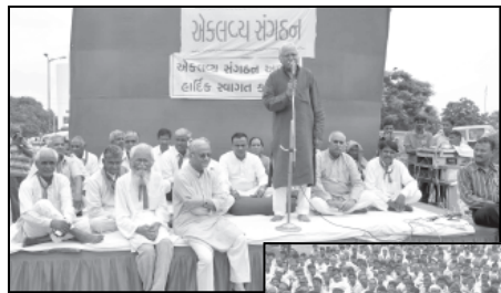
આદીવાસીઓ આજે ગુરૂવારે હિંમતનગરમાં કુચ કરી રેલી સ્વરૂપે નીકળી કલેક્ટરને આવેદન પત્ર આપી પોતાની સમસ્યા રજૂ કરી હતી.

જંગલની જમીનનો હક્ક મેળવવા સાબરકાંઠાના આદીવાસીઓએ રેલી કાઢી આવેદનપત્ર આપ્યું : જમીન હક્ક આપવામાં સરકારની કુટનીતિ સામે વનવાસીઓમાં આકોશ હિંમતનગર, તા. ૮ વન અધિકાર ૨૦૦૬ અંતર્ગત જંગલ જમીનમાં ખેડાણ કરતાં આદીવાસીઓ કે જેને હજુ જંગલની જમીનનો હક્ક મળ્યો નથી તેવા તમામ