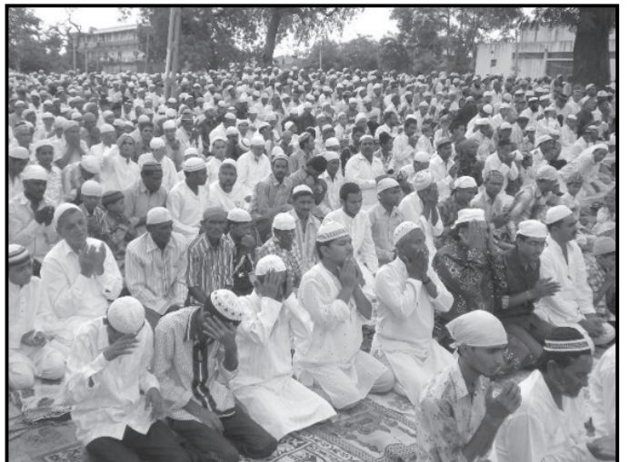
પાલનપુર ખાતે આજે મુસ્લિમ બિરાદરોના પવિત્ર તહેવાર રમઝાન ઈદની ભારે ઉત્સાહપૂર્વક ઉજવણી કરવામાં આવી હતી. ઈદ ઉલ ફિત્રની ઉજવણી નિમિત્તે પાલનપુરની ઈદગાહ પર મુસ્લિમ બિરાદરો ધ્વારા નમાજ અદા કરવામાં આવી હતી. આ પ્રસંગે શહેર કક્ષીએ કોમી એકતા પર ભાર મુકતા દેશમાં અમન ઓર થમન બની રહે તેવી શુભકામનાઓ પાઠવી હતી. આ વિશેષ નમાજ અદા કરવામાં પાલનપુર પંચકમાંથી હજારો મુસ્લિમ બિરાદરો ઉમટી પડ્યા હતા.

વવાલીયર, હેદરાબાદ, કલકત્તા, પટણા, લખનૌ અને શ્રીનગર સાથે વિશાખાપટનમ કરતાં પણ અમદાવાદમાં બળાહારનું પ્રમાણ વધારે છે. આમ એકંદરે ગયા વરસની સરખામણીમાં ૧૫૦ દિવસમાં ૧૦૭ બળાહારના કિસ્સાઓ નોંધાયા છે. મહિલાઓ અને બાળકોના અપહરણના કિસ્સામાં ગયા વરસની સરખામણીમાં ૨૦૧૩ના પ્રથમ પાંચ માસમાં સુરતમાં ૬, ગાંધીનગરમાં ૩૫, રાજકોટમાં ૧૮, જૂનાગઢમાં ૨૨, બરોડામાં ૨૨ અને સુરતમાં ૧૪ એમ મળીને કુલ ૨૨૭ અપહરણના કેસોમાં વધારો નોંધવામાં આવ્યો છે. એટલે કે ગુજરાતમાં રોજના ૩ મહિલાઓ/બાળકો પર અપહરણની સામે ૨૦૧૩માં રોજના ૫ કિસ્સાઓ નોંધવામાં આવ્યા છે.