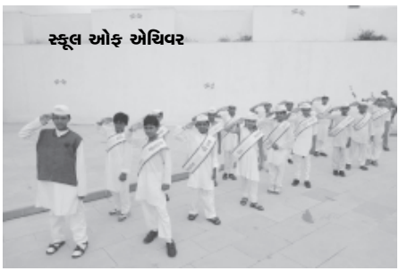
સ્કૂલ ઓફ એચિવર