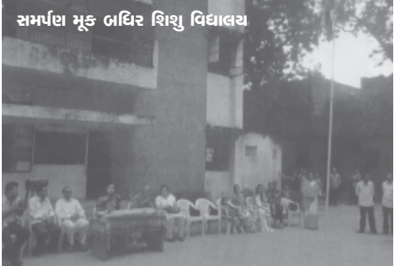
સમર્પણ મૂક બઠિર શિશુ વિદ્યાલય

અંતમાં સૌએ ‘ભારત માતા કી જય, વંદે માતરમ્’ના ગગન ભેદી