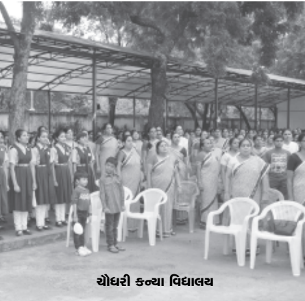
ચૌધરી કન્યા વિદ્યાલય

સ્વાતંત્ર દિનની ઉજવણી બાદ મધુર ડેરીમાં ઈન્ડિયન મેડીકલ