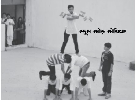
સ્કૂલ ઓફ એચિવર

મધુર ડેરી ખાતે ધ્વજવંદનનાં કાર્યક્રમ પ્રસંગે રાષ્ટ્રભાવના