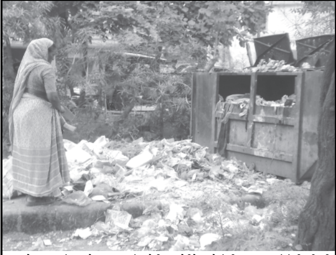
સેક્ટર-૨ ઝાંઝા મુખ્ય રોડ પર મુકવામાં આવેલી કચરાપેટીને કારણે ગંદકી દુર કરવા કરતાં ગંદકી વધી રહી છે. આ જગ્યાએ જ કેમ કચરાપેટી મુકાય છે એ પ્રશ્ન છે.