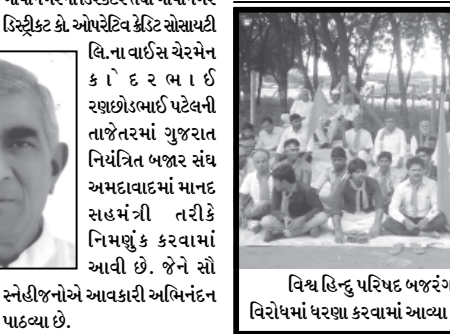
વિશ્વ હિન્દુ પરિષદ ભરૂચ દળ ગાંધીનગર જિલ્લા દ્વારા ૮ જ કોસી પરિક્રમા ઉપર મુકેલ પ્રતિબંધ તથા સંતો અને હિંદુ નેતાઓની ધરપકડના વિરોધમાં ધરણા કરવામાં આવ્યા હતા. અને ત્યારબાદ ગાંધીનગર જિલ્લા કલેક્ટરશ્રીને આવેદનપત્ર સોંપવામાં આવ્યું હતું.