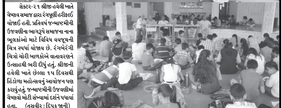
સેક્ટર-૨ ૧ શ્રીજી હવેલી ખાતે વેષ્ણવ સમાજ દ્વારા રંગપૂર્ણ હરીફાઈ યોજાયેલી હતી. પ્રતિવર્ષ જન્માષ્ટમીની ઉજવણીના ભાગરૂપે સમાજના નાના ભૂલકાંઓ માટે વિવિધ વયજૂથની ચિત્ર સ્પર્ધા યોજાય છે. રંગબેરંગી ચિત્રો ચોરી બાળકોએ વાતાવરણને ઉત્સાહથી ભરી દીધું હતું. શ્રીજી હવેલી ખાતે છેલ્લા ૧૫ દિવસથી હિંડોળા મહોત્સવનું આયોજન પણ કરાયું હતું. જન્માષ્ટમીની ઉજવણીમાં વેષ્ણવો મોટી સંખ્યામાં દર્શને પધાર્યા હતા.