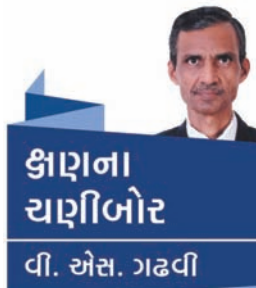
કાણના ચાણીબોર વી. એસ. ગઢવી

દન ગણતા જેટલે ગયો કાળી ઘટા ધન કાઢ એણી પેરે કાના આવજો ! આયો માસ અષાઢ. આપણો નાળ સંબંધ - આપણો સહજ સંબંધ પ્રકૃતિ સાથે અભિન્ન રીતે બંધાયો છે. અષાઢી બીજનો દિવસ કોરો જાય અને વરસાદ રાહ જોવરાવે ત્યારે તમામ લોકોને મનમાં કંઈક ખટકવા કરે છે. જીવનમાં કંઈક ખૂટતું હોય, કશુંક ઓછું હોય તેવો ભાવ થયા કરે છે. વરસાદ સાથે ગ્રામ જીવન - કૃષિ જીવનને તો આર્થિક પરિબળોને કારણે પણ એક જોડાણ હોય છે. વરસાદ આવે તો જ કૃષિકારને ખેતીની આબાદીનો અનુભવ થાય. પરંતુ આજે તો દેશની ફૂલ વસતીનો ઘણો મોટો ભાગ શહેરો કે નાના નગરોમાં વસે છે. શહેરીકરણની અવિરત ચાલતી પ્રક્રિયાના કારણે ગામડાઓમાંથી નગરોમાં વસવાટ કરવા માટે જનાર લોકોની વણઝાર મંદ પડતી નથી. આથી ખેતીના વ્યવસાય સાથે કે પશુપાલના વ્યવસાય સાથે કોઈ સીધો સંબંધ ન ધરાવતા હોય તેવા લોકોને વરસાદની પરવા નથી તેમ માની શકાય તેવું નથી. શહેરીજનો પણ અનેક કારણોસર વરસાદની કાગડોળેજ રાહ જોતા હોય છે. આ બાબત એ વાતનું આધ્યાસન આપે છે કે પ્રકૃતિ સાથેનો આપણો નાતો કોઈ મર્યાદિત ગણતરી પર આધારીત નથી. પૃથ્વી તથા પ્રકૃતિ સાથેનો આપણો સંબંધ ક્ષીણ થયો હોય તેમ કહેવું તે પૂર્ણ સત્ય નથી. વરસાદ થાય કે તરતજ વરસાદી મોજ લેવા આપણાં તમામ લોકો નીકળી પડે છે તે દ્રશ્ય જોવું આહલાદક હોય છે. ઋતુઓ સાથેનો આ સંબંધ જે કવિ કુલગુરુ કાળિદાસે ગાયો હતો તે આજે પણ અતીતની ધૂણી જેમ ધમ્મી રહેલો છે, જીવંત છે. કવિ ગુરુ ટાગોરના ઉત્તમ વર્ણનોનો ઝવેરચંદ મેઘાણીએ આપણી ભાષામાં કૃશળતાપૂર્વક ઉતારેલા છે. 'મન મનો બની થનગાટ કરે' નો કવિગુરુનો ઉત્કટ ભાવ મેઘાણી સિવાય આપણાં સુધી પહોંચી શક્યો ન હોત. વરસાદની જેમ કુદરતી જળાશયો માટે પણ ગ્રામજનો તેમજ નગરજનોના મનમાં એક ખેંચાણ રહે છે. ભૂજ (કચ્છ) માં હમીસર તળાવ છલકાય