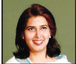
શર્મા તેમજ અન્ય આગેવાનો તથા મંત્રીઓ હાજર રહ્યા હતા. જેમાં