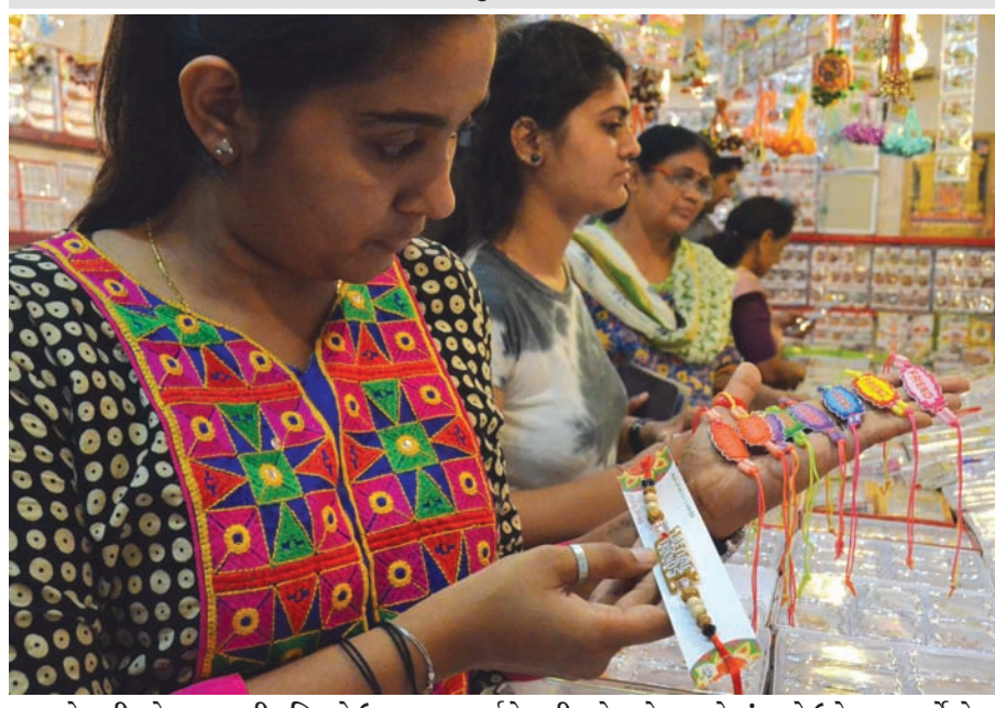
કેન્ડશીપ ૩ - આગામી રવિવારે ઉજવાનાર વર્લ્ડ કેન્ડશીપ-૩ માટે યુવાનોમાં ભારે ઉત્તેજના પ્રવર્તે છે... આજકાલ કેન્ડશીપ બેલ્ટની ખરીદી વ્યાપક પ્રમાણમાં થઈ રહી છે... મિત્રતાના સંદર્ભના શુભેચ્છા કાર્ડ પણ અલગ અલગ ડીઝાઈનમાં થોકબંધ બજારમાં ઠલવાયા છે...

મચ્છરોના બ્રિડીંગ મળી આવ્યા હતા. વારંવારની સૂચનાઓ સાઈટ સંચાલકોને આપવામાં આવ્યા પછી પણ પગલાં ન લેવાતાં આજે મ્યુનિ. કમિશનરની સહિથી આ નોટીસ પાઠવવામાં આવી છે. આજની નોટીસમાં