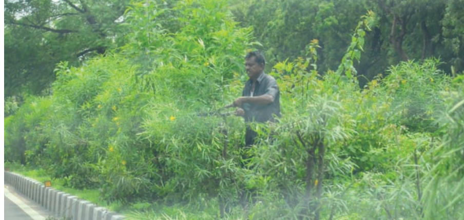
ટ્રીમીંગ - શહેરના મુખ્ય માર્ગો સેન્ટ્રલ વર્જમાં આડેધડ વિકસેલ ઘાસ અને છોડનું ટ્રીમીંગ પુરજોશમાં ચાલી રહ્યું છે... ચોમાસાની મોસમમાં ઘાસચારો વ્યાપક પ્રમાણમાં શહેરમાં વિકસે છે... ત્યારે વાહન ચાલકોને હાલાકી ન સર્જાય તે માટે ટ્રીમીંગ દ્વારા સરળતા ઉભી કરવાનો પ્રયાસ તંત્ર દ્વારા હાથ ધરાયો છે...

સ્માર્ટ સીટી, મનરેગા, આદર્શ ગ્રામ, અમુતમ યોજના, આવાસ યોજના સહિત અન્ય કેટલીક યોજનાઓમાં થયેલી કામગીરીની સમીક્ષા આ બેઠકમાં કરવામાં આવશે. મળતી વિગતો પ્રમાણે જિલ્લાતંત્ર દ્વારા આ અંગેની તૈયારીઓ પણ હાથ ધરી દેવામાં આવી છે.