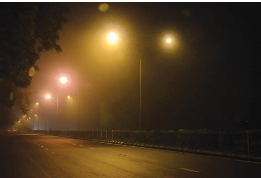
ધુમ્મસ - મોડીસાંજથી જ શહેરમાં ભેજનું પ્રમાણ વધતા ધુમ્મસનું વાતાવરણ સર્જાયું હતું... વેરા ધુમ્મસના કારણે રાહદારીઓને અને વાહન ચાલકોને પણ હાલાકી પડી હતી... સૂર્યોદય બાદ ધીમેધીમે ધુમ્મસ ઓછું થતાં વાહન ચાલકોને વાહન ચલાવવામાં સરળતા સર્જાઈ હતી....

સૂત્રોમાંથી જાણવા મળેલ છે. તંત્રના સૂત્રોમાંથી પ્રાપ્ત થતી વિગતો પ્રમાણે જિલ્લાના આરોગ્ય તંત્રની એક ટીમ પણ સવારે પાનસર પહોંચી રહી છે. જિલ્લામાં ચાંદીપુરમ રોગને લઈ તાજેતરમાં જ દહેગામ ખાતે જિલ્લાના તબીબી અધિકારીઓને સતર્ક રહેવા માટેની સૂચનાઓ આપી આખો વર્કશોપ યોજવામાં આવ્યો હતો જે ઉલ્લેખનીય છે. ચાંદીપુરમના કેસો સામાન્યતઃ ચોમાસા દરમિયાન જ નોંધાતા હોય છે.