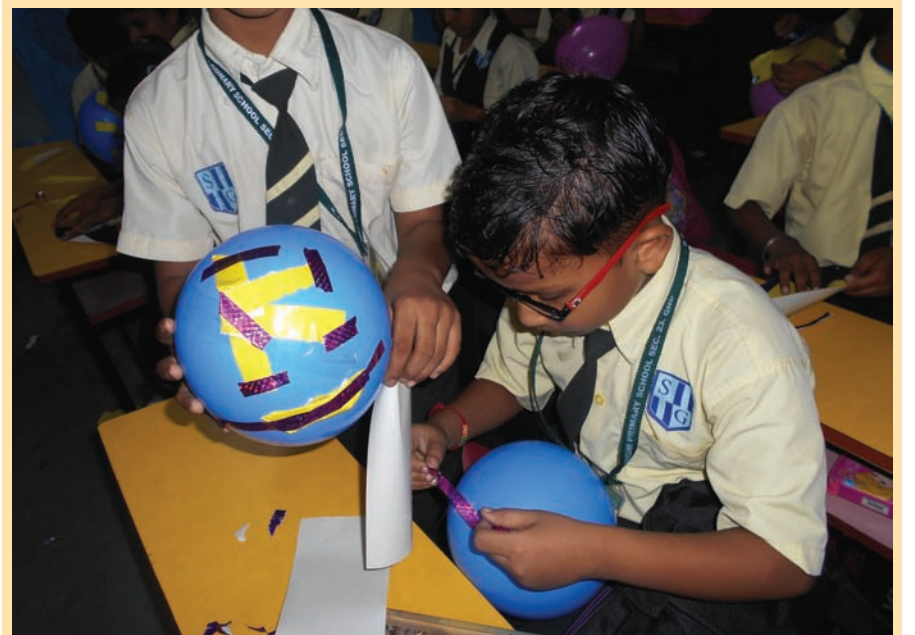
કડી સર્વ વિદ્યાલય સંચાલિત એસ જી અંગ્રેજી માધ્યમની પ્રાથમિક શાળા ખાતે શુક્રવારે ધોરણ-૧ થી ૪ના વિદ્યાર્થીઓ માટે કુગ્ગા શણગારવાની પ્રવૃત્તિનું આયોજન કરવામાં આવ્યું હતું. આ પ્રવૃત્તિ અંતર્ગત બાળકોએ કૂલની પાંદડી, રંગીન કાગળ, પેન્સિલના છોલ વગેરેથી કુગ્ગાને સુંદર રીતે શણગાર્યા હતા. દરેક ધોરણમાંથી ત્રણ વિદ્યાર્થીઓને શ્રેષ્ઠ શણગાર બદલ ઈનામો એનાયત કરવામાં આવ્યાં હતાં. પોતાને ગમતા કુગ્ગાને સજાવવાની આ પ્રવૃત્તિમાં બાળકોએ ઉત્સાહભરે ભાગ લીધો હતો.

શ્રી અરવિંદનો જન્મદિવસ ઉજવાશે ગાંધીનગર, તા. ૧૨ આગામી તા. ૧૫ ઓગસ્ટ ને સોમવારના રોજ શ્રી અરવિંદના જન્મદિવસ નિમિત્તે શ્રી અરવિંદ કેન્દ્ર, સેક્ટર-૨૩, ગાંધીનગર ખાતે સવારે ૮.૩૦થી ધ્યાન, પ્રાર્થના તથા 'ભગવદ્ ગીતાનો દિવ્ય સંદેશ' વિષય ઉપર ઓજસી પરમેશ્વરનું જાહેર પ્રવચન અને સાંજે પાંચથી નવ દરમ્યાન આંબેડકર હોલ, સેક્ટર- ૧૨ ખાતે સંસ્થાના વિદ્યાર્થીઓ દ્વારા નૃત્ય તથા સંગીત સંધ્યાનો કાર્યક્રમ આયોજિત કરવામાં આવ્યો છે.