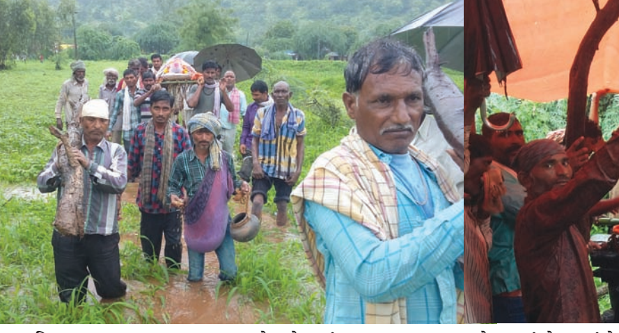
હિંમતનગર તાલુકા પુનાસણ નજીક આવેલ ગોપાલકુંજ ગામ સ્મશાનના અભાવે ગામમાં ચોમાસામાં કોઈ મૃત્યુ પામે ત્યારે પ્લાસ્ટિકનું આવરણ રાખી ગ્રામજનો અગ્નિસંસ્કાર કરે છે.