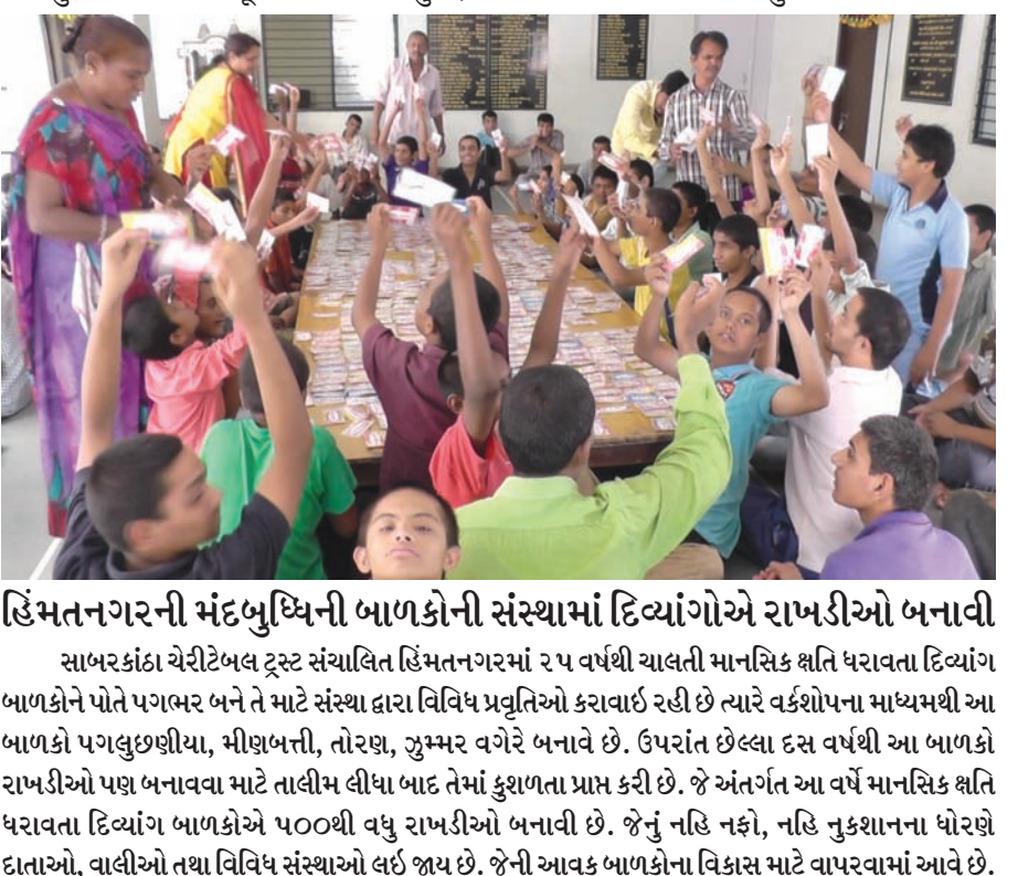
હિંમતનગરની મંદબુધ્ધિની બાળકોની સંસ્થામાં દિવ્યાંગોએ રાખડીઓ બનાવી સાબરકાંઠા ચેરીટેબલ ટ્રસ્ટ સંચાલિત હિંમતનગરમાં ૨૫ વર્ષથી ચાલતી માનસિક ક્ષતિ ધરાવતા દિવ્યાંગ બાળકોને પોતે પગભર બને તે માટે સંસ્થા દ્વારા વિવિધ પ્રવૃત્તિઓ કરાવાઈ રહી છે ત્યારે વર્કશોપના માધ્યમથી આ બાળકો પગલુછણીયા, મીણબતી, તોરણ, ઝુમ્મર વગેરે બનાવે છે. ઉપરાંત છેલ્લા દસ વર્ષથી આ બાળકો રાખડીઓ પણ બનાવવા માટે તાલીમ લીધા બાદ તેમાં કુશળતા પ્રાપ્ત કરી છે. જે અંતર્ગત આ વર્ષ માનસિક ક્ષતિ ધરાવતા દિવ્યાંગ બાળકોએ ૫૦૦થી વધુ રાખડીઓ બનાવી છે. જેનું નહિ નફો, નહિ નુકશાનના ધોરણે દાતાઓ, વાલીઓ તથા વિવિધ સંસ્થાઓ લઈ જાય છે. જેની આવક બાળકોના વિકાસ માટે વાપરવામાં આવે છે.