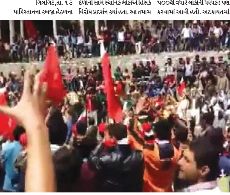
કાશ્મીર (પોક)ના ગિલગિટ બાલિસ્તાનમાં સ્થાનિક લોકો દ્વારા જોરદાર વિરોધ પ્રદર્શન કરવામાં આવ્યું છે. પાકિસ્તાનના સુરક્ષા

૫૦૦થી વધુ લોકોની સુરક્ષા દળો દ્વારા અટકાયત કરાઈ : પાકિસ્તાનના મામલામાં વડાપ્રધાન નરેન્દ્ર મોદીના નિવેદન બાદ અસર થઈ હોવાનો અહેવાલ : પાકિસ્તાની સેના, સરકારની સામે લોકો મેદાનમાં ઉતર્યા