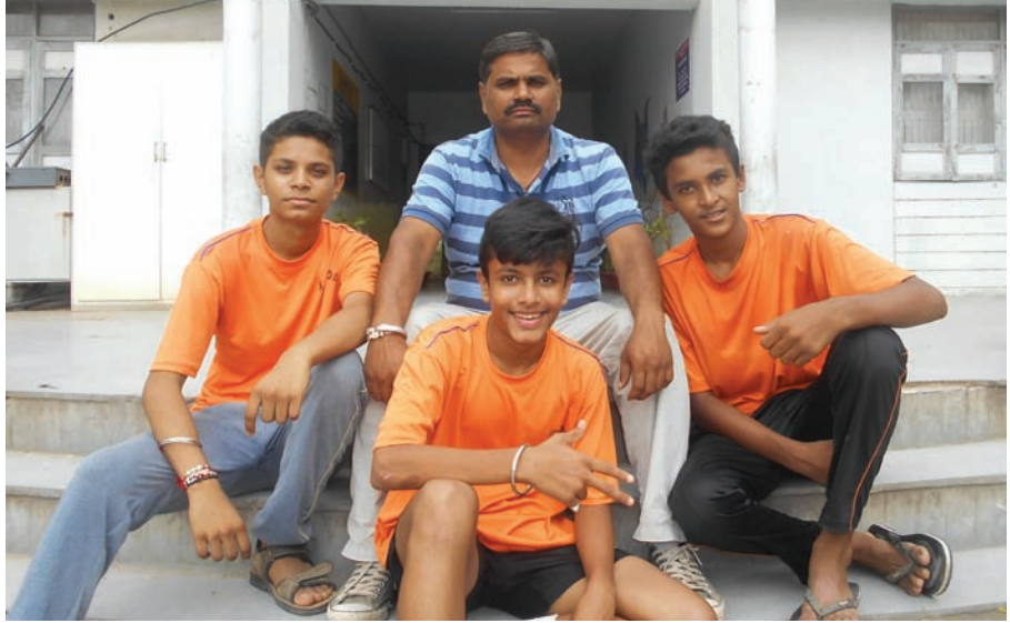
અંસજી અંગ્રેજી માધ્યમની સ્કૂલના વિદ્યાર્થીઓએ જિલ્લા કબડી સ્પર્ધામાં પ્રથમ ક્રમાંક મેળવ્યો હતો. શાળા પરિવારે આ વિજેતા ખેલાડીઓને બિરદાવી અભિનંદન પાઠવ્યા હતા.