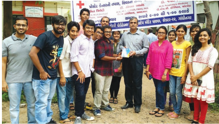
ક્રી મેડીકલ કેમ્પ : રોટરેટ ક્લબ ઓફ ગાંધીનગર દ્વારા ગેસ્ટો, ન્યૂરો અને પન્મોલોજી ક્રી મેડીકલ કેમ્પ યોજાયો હતો. શહેરના સંખ્યાબંધ દર્દીઓને તપાસવામાં અમદાવાદના જાણીતા ત્રણ તબીબોએ ચાર કલાક સેવા આપી હતી. રોટરેટ ક્લબના યુવાનોના સેવાકીય અભિગમને સૌએ બિરદાવ્યો હતો.