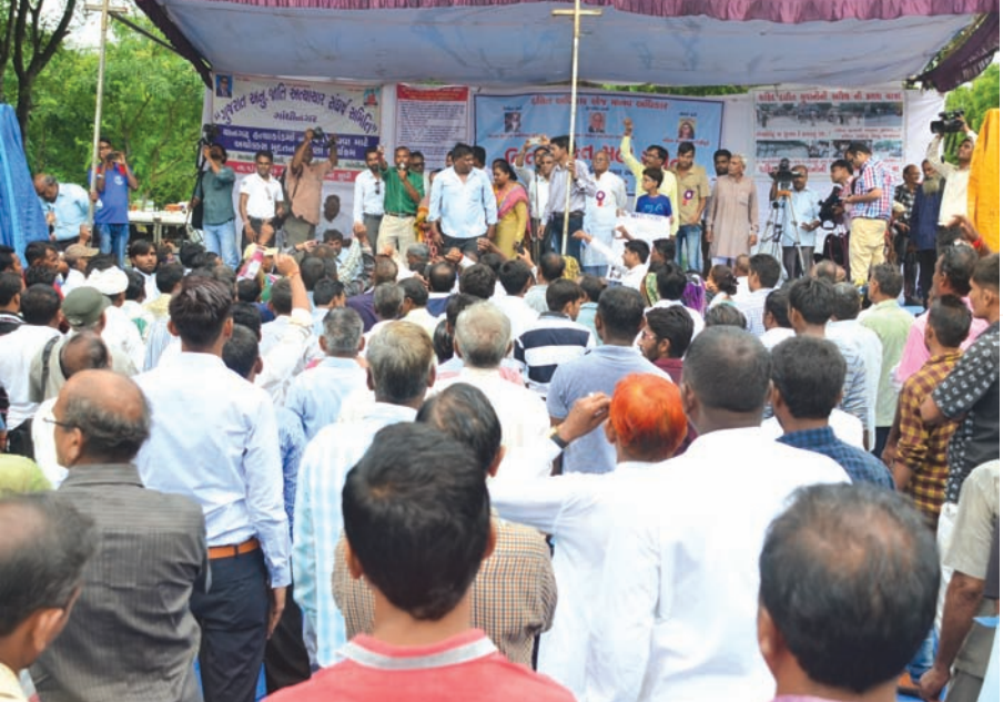
ગાંધીનગર સે. ૬ સત્યાગ્રહ છાવણી ખાતે ધરણા પર બેઠેલા તાનગઢના દલિત પરિવારો દ્વારા આજે થાનગઢ અત્યાચાર સંઘર્ષ સમિતિના નેજા હેઠળ રેલીનું આયોજન કરાયું હતું. આ રેલી ઘ-૨ સર્કલથી સત્યાગ્રહ છાવણી ખાતે આવી પહોંચી હતી. ત્યારબાદ સભા યોજાઈ હતી. આ કાર્યક્રમમાં રાજ્યભરમાંથી દલિત સમાજના ભાઈ-બહેનો મોટી સંખ્યામાં હાજર રહ્યા હતા. અત્યાચાર સંઘર્ષ સમિતિ દ્વારા સીબીઆઈ તપાસની માંગ કરી છે.

ગાંધીનગર, તા. ૨૧ ગાંધીનગર જિલ્લાના કલોલ તાલુકામાં આવેલા પલીયડ ગામમાં બે દિવસ અગાઉ ગળે ફાંસો ખાધેલી હાલતમાં એક આધેડનો ખેતરની ઓરડીમાંથી મૃતદેહ મળ્યો હતો. પરિવારજનોએ દફનવિધી પણ પતાવી દીધી હતી. બે દિવસ બાદ મૃતકના પુત્રને શંકા ઉપજી કે કોઈએ તેના પિતાની હત્યા કરીને મૃતદેહ લટકાવી દીધો છે. શંકાને આધારે પોલીસે એફએસએલ બોલાવી આજે સ્મશાનમાં દફનાવેલો મૃતદેહ બહાર કાઢી પેનલ ડોક્ટરથી પી.એમ. કરાવ્યું હતું. કોઝ ઓફ ડેથ હજુ પેન્ડિંગ છે તેના રીપોર્ટ બાદ હત્યા કે આત્મહત્યા સંદર્ભે પોલીસ વધુ તપાસ શરુ કરશે. મળતી માહિતી મુજબ કલોલના પલીયડ ગામની ઘટના : ખેતરની ઓરડીમાં ગળે ફાંસો ખાધેલી હાલતમાં મૃતદેહ મળ્યા બાદ પરિવારજનોએ દફનવિધી કરાવી હતી : પિતાની હત્યા થઈ હોવાની શંકા જતા મૃતદેહ બહાર કાઢી પેનલ ડોક્ટરથી પી.એમ. કરાવ્યું