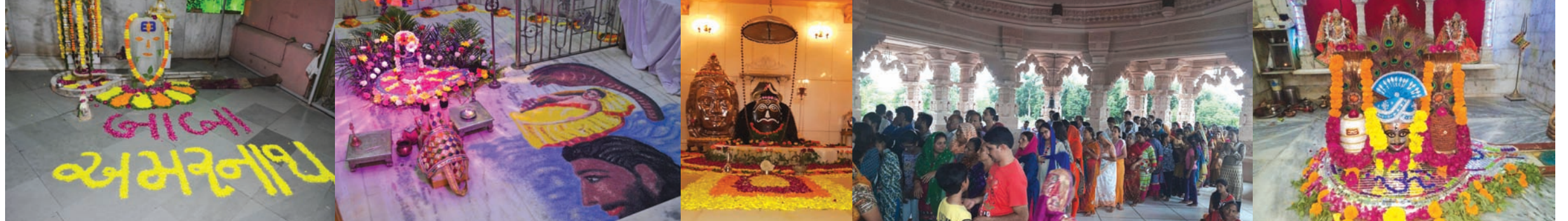
શ્રાવણ માસનો અંતિમ તબક્કો ચાલી રહ્યો છે. શહેરના મંદિરોમાં ભાવિકોની ભીડ જોવા મળી રહી છે. સે-૨૧ વેજનાથ મહાદેવ મંદિર, કોટેશ્વર મહાદેવ મંદિર તથા સે-૮ ત્ર્યંબકેશ્વર મહાદેવ મંદિરે વિવિધ સાજ શણગાર સાથે ધાર્મિક કાર્યક્રમોનું આયોજન થયું છે.