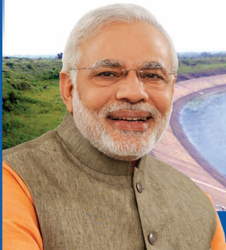
શ્રી નરેન્દ્રભાઈ મોદી માનનીય વડાપ્રધાન

દુઃખ ભરે દિન બિતે રે ભૈયા... અબ સુખ આયો રે... રંગ જીવનમેં નયા લાયો રે