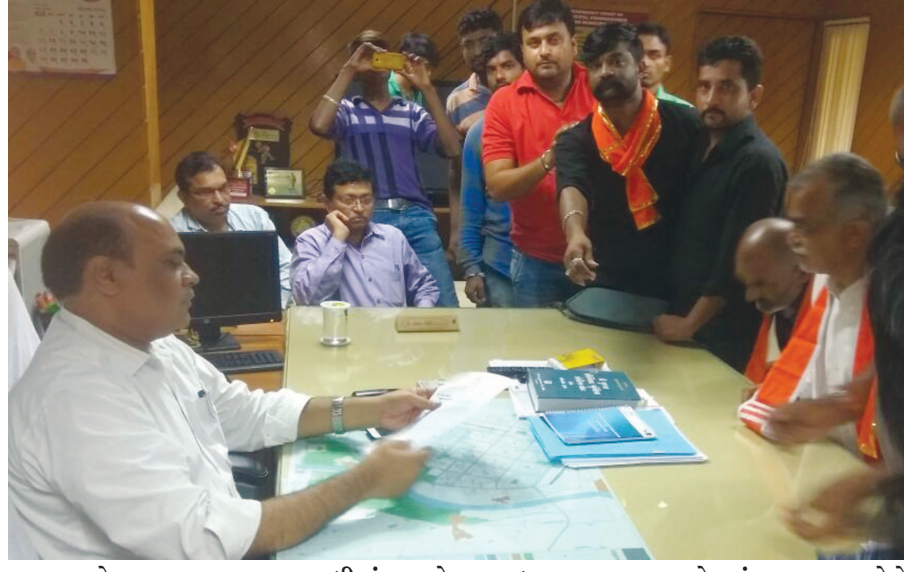
આવેદનપત્ર આપવા આવેલા કાર્યકરો એ મ્યુનિ. કમિશનરશ્રીની કચેરી આગળ રામધૂન પણ બોલાવી હતી. સુધીમાં ૮૫ જેટલુ પશુધન મૃત્યુ પામ્યુ હોવાની ચોકવાતરી હકીકતો પણ બહાર આવી છે જે ખુબજ દુઃખદાયક છે. ચોમાસામાં પણ ચાલતુ હોવાનું પણ જણાવ્યુ છે કે યોગ્ય તપાસ કરી તાત્કાલિક પગલાં લો નહિ તો આંદોલન કરવાની ફરજ પડશે.

ગાંધીનગર, તા. ૩૧ આ આવેદનપત્રમાં ગાંધીનગર મનપા સંચાલિત ઢોર ડબ્બામાં ગેરવ્યવસ્થાને લઈ આજે વિશ્વ હિન્દુ પરિષદ તથા બજરંગ દળ ગાંધીનગર દ્વારા મ્યુનિ. કમિશનરને આવેદન પત્ર આપવામાં આવેલ છે. આ આવેદનપત્રમાં જણાવવામાં આવ્યા મુજબ ભારે વરસાદને પગલે આ ઢોરવાડો કાદવ-ક્રીચડથી ખદબદી રહ્યો છે અને નર્ક કરતાં પણ ખરાબ સ્થિતિ અહિ રખાયેલા પશુધન માટે છે. આ ઢોરવાડામાં અત્યાર સફાઈ કરવામાં નહિ આવતી હોવાની હકીકતો જાણવા અને જોવા મળી છે. આ બધી બાબતોની તપાસ કરવાની માંગ કરતાં આવેદનપત્રમાં અમદાવાદ ગૌશાળામાં મોકલાવી છે તે બારોબાર વેચી મારવાનું રોકેટ