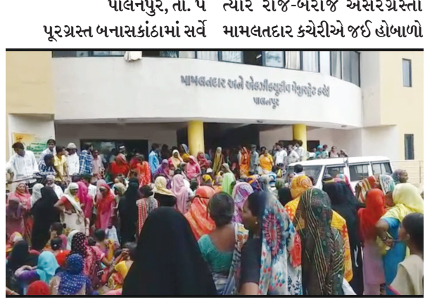
પાલનપુર, તા. ૫ ત્યારે રોજ-બરોજ અસરગ્રસ્તો પૂરગ્રસ્ત બનાસકાંઠામાં સર્વે મામલતદાર કચેરીએ જઈ હોબાળો

અસરગ્રસ્તોના આક્રમક રૂખને જોતા પોલીસે મામલતદાર કચેરીનો દરવાજો બંધ કરવાની ફરજ પડી હતી