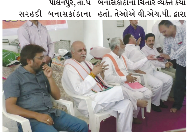
પાલનપુર, તા.૫ બનાસકાંઠાનો ચિતાર વ્યક્ત કર્યો સરહદી બનાસકાંઠાના હતો. તેઓએ વી.એચ.પી. દ્વારા

૩ ટ્રક રાહત સામગ્રીને રવાના : પશુ ખરીદી સહાયમાં વધારો કરવાની માંગ