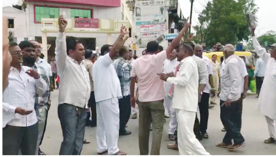
અસરગ્રસ્તો ની મુલાકાતે આવેલા ગાંધીની કારનો કાચ તૂટી ગયો હતો હુમલામાં ભાજપ ના ગુંડાઓનો હાથ

રસ્તા પર ચક્કાજામ અને સુનોચાર પોકાર્યા હતા. મોડાસા ટાઉન પોલીસે કરી હતી. અરવલ્લી જિલ્લા કોંગ્રેસ સમિતિ દ્વારા શનિવારે બપોરે જિલ્લા ના મુખ્યમથક મોડાસા ચાર રસ્તા પર કોંગ્રેસ ના રાષ્ટ્રીય ઉપાધ્યક્ષ રાહુલ ગાંધી ની કાર પર પથ્થરમારો થતા લોકશાહી પર હુમલો ગણાવી આક્રમક વિરોધ પ્રદર્શન કરવામાં