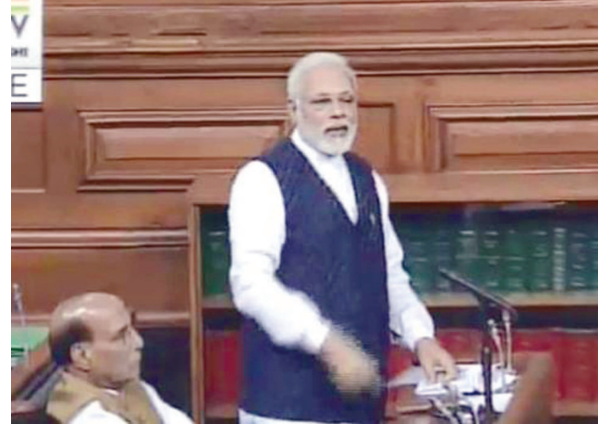
અનુસંધાન પાન-૭ પર

નવી દિલ્હી, તા. ૯ વડાપ્રધાન નરેન્દ્ર મોદીએ આજે કહ્યું હતું કે, દેશવાસીઓને દુનિયાના દેશો માટે આજની સ્થિતિમાં એવી જ પ્રકારથી પ્રેરણા લેવી જોઈએ જેવી પ્રેરણા ૧૯૪૨ના આંદોલનમાં મળી હતી. ૧૯૪૨ના આંદોલન બાદ ભારતે દુનિયાને પ્રેરિત કરવામાં ભૂમિકા ભજવી હતી. ૧૯૪૨ના ભારત છોડો આંદોલનની આજે ૭૫મી વર્ષગાંઠ પર લોકસભામાં વિશેષ ચર્ચા થઈ હતી જેમાં વડાપ્રધાન નરેન્દ્ર મોદીએ ભાગ લીધો હતો. વડાપ્રધાને કહ્યું હતું કે, ગરીબી, કુપોષણ, ભ્રષ્ટાચાર દેશની સામે સૌથી મોટા પડકાર તરીકે છે. મોદીએ ઉમેર્યું હતું કે, આજે અમે ૨૦૧૭માં છીએ ત્યારે તેઓ આ