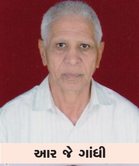
આર જે ગાંધી