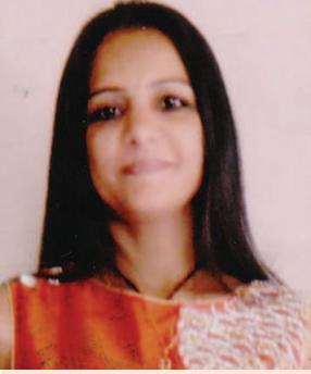
દિશા જનસારી લાલોનેસ કલબ