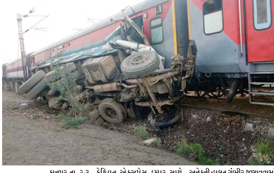
કાનપુર, તા. ૨૩ ઉત્તરપ્રદેશના ઓરૈયા જિલ્લામાં આજે વહેલી સવારે આઝમગઢથી દિલ્હી તરફ જનાર કેફિયત એક્સપ્રેસ ડમ્પર સાથે ટકરાઈને પાટા પરથી ખડી પડતા ઓછામાં ઓછા ૮૦ લોકોને ઈજા થઈ છે. ઘાયલ થયેલા લોકો પૈકી

વડાપ્રધાને રાહ જોવા માટે કહ્યું : એક પછી એક રેલવે દુર્ઘટનાઓની સુરેશ પ્રભુએ નૈતિક જવાબદારી સ્વીકારી નવી દિલ્હી, તા. ૨૩ રેલવે અકસ્માતોનો સિલસિલો યથાવત રીતે જારી રહેતા આજે રેલવે મંત્રી સુરેશ પ્રભુએ ટ્રેન દુર્ઘટનાઓની નૈતિક જવાબદારી સ્વીકારીને હોદ્દા પરથી રાજીનામું આપી દેવાની ઓફર કરી હતી. આજે એક પછી એક ટ્વીટ કરીને પ્રભુએ રાજીનામાની ઓફર કરી હતી. વડાપ્રધાન નરેન્દ્ર મોદીને મળીને રાજીનામાની ઓફર કરી હતી. મોદીને રાજીનામા સોંપી ચુક્યા હોવાના સંકેત પણ પ્રભુએ આપ્યા હતા. મોદીએ તેમને રાહ જોવા માટે કહ્યું છે. પ્રભુએ તમામ નૈતિક જવાબદારી લીધી છે અને પોતાના પક્ષને