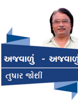
અજવાળું - અજવાળું તુષાર જોદા