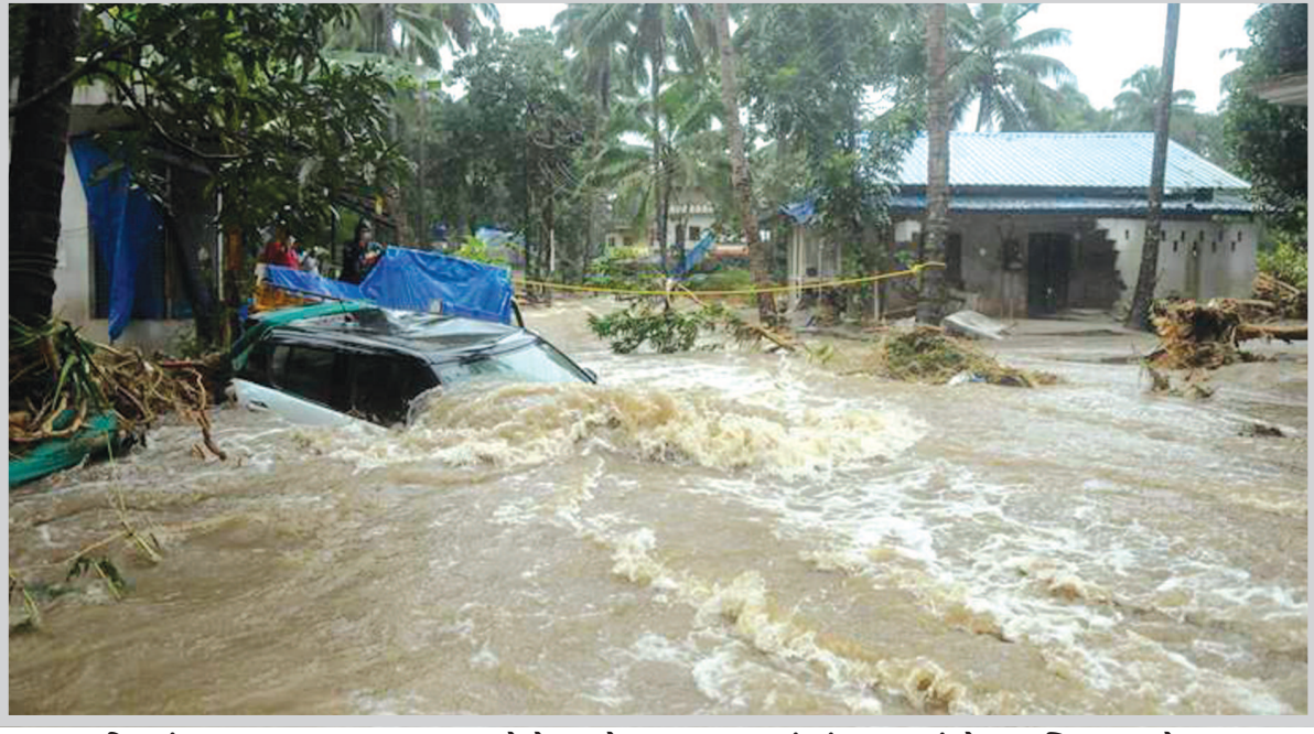
નિરુવંતરપુરમ,તા.૯ કેરળના અલગ-અલગ વિસ્તારમાં ગુરૂવારે ભારે વરસાદ અને ભુસ્ખલનની ઘટનાઓમાં લગભગ ૨૦ લોકોના મોત નિપજ્યા છે. આપદા નિયંત્રણ કક્ષના સૂત્રોના જણાવ્યા અનુસાર, ઈડુક્કીમાં ભૂસ્ખલનમાં ૧૦, મલપુરમમાં પાંચ, કનૂરમાં બે અને વાયનાડ જલ્લામાં ૧ નું મોત નિપજ્યું છે. વાયનાડ, પલક્કડ અને કોલ્લિકોડ જલ્લામાં એક-એક વ્યક્તિ લાપતા છે. ઈડુક્કીના અડીમાલી શહેરમાં એક જ પરિવારના પાંચ

સેના પાસે મદદ માંગવામાં આવી : પેરિયાર નદીનું જળસ્તર વધી જવાના કારણે વધુ પાણી છોડવા માટે દંદમલયાર કેમના ચાર દરવાજા ખોલી દેવામાં આવ્યા