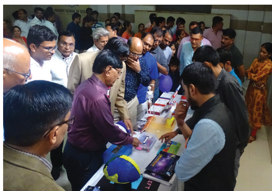
અગ્રીમ દરજ્જે અપાવનાર પૂર્વ રાષ્ટ્રપતિ અને મહાન વિજ્ઞાની ડૉ. એપીજે અબ્દુલકલામ જોયેલા સ્વપ્ને સાકાર કરવાના ઉમદા હેતુસર ચાલતી આ પ્રવૃત્તિના માધ્યમથી વિદ્યાર્થીઓમાં વૈજ્ઞાનિક

ગાંધીનગર, તા. ૯ સરગાસણ સ્થિત રેડિયન્ટ સ્કૂલ ઓફ સાયન્સમાં જિલ્લા કક્ષાના એપીજે અબ્દુલકલામ યંગ સાયન્ટીસ્ટ સેન્ટરનું ઉદ્ઘાટન કરવામાં આવ્યું છે. વિજ્ઞાન પ્રસાર નેટવર્ક ઓફ સાયન્સ ક્લબ, ગવર્મેન્ટ ઓફ ઈન્ડિયાની દેખરેખ હેઠળ ચાલતા વિજ્ઞાનના આ યુનિટને વેગ આપી રહેલા ડૉ. ચંદ્રમોલી જોષીના સમગ્ર આયોજન અને માર્ગદર્શન હેઠળ આ સેન્ટરનો પ્રારંભ કરવામાં આવ્યો છે. પ્રારંભ પ્રસંગે ઈસરોના વિજ્ઞાની ડૉ. ભરત ચિન્યારા, બીએઆરસી વિભાગ અધ્યક્ષ ડૉ. એસ એલ ભોરણીયા અને ગુજરાત આર્ટ્સ એન્ડ સાયન્સ કોલેજ, અમદાવાદના પ્રોફેસર ડૉ. રાજેશ ડી મોદે ઉપસ્થિત રહ્યા હતા. ભારત દેશને વિજ્ઞાન ક્ષેત્રમાં