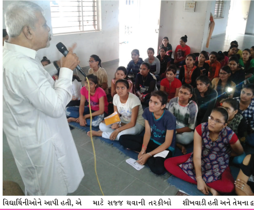
વિદ્યાર્થીનીઓને આપી હતી, એ માટે સજ્જ થવાની તરકીબો શીખવાડી હતી અને તેમના દ્વારા