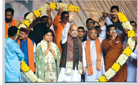
ભારે ધાંધલ ધમાલ બાદ ભાજપ પ્રમુખ અમિત શાહે આજે પશ્ચિમ બંગાળના પાટનગર કોલકાતામાં વિશાળ રેલી કરી હતી. જેમાં

કોલકાતા, તા. ૧૧ અમિત શાહ મુખ્યમંત્રી મમતા એનઆરસીના મુદ્દા પર બેનર્જી ઉપર તેજાબી પ્રહારો કર્યા