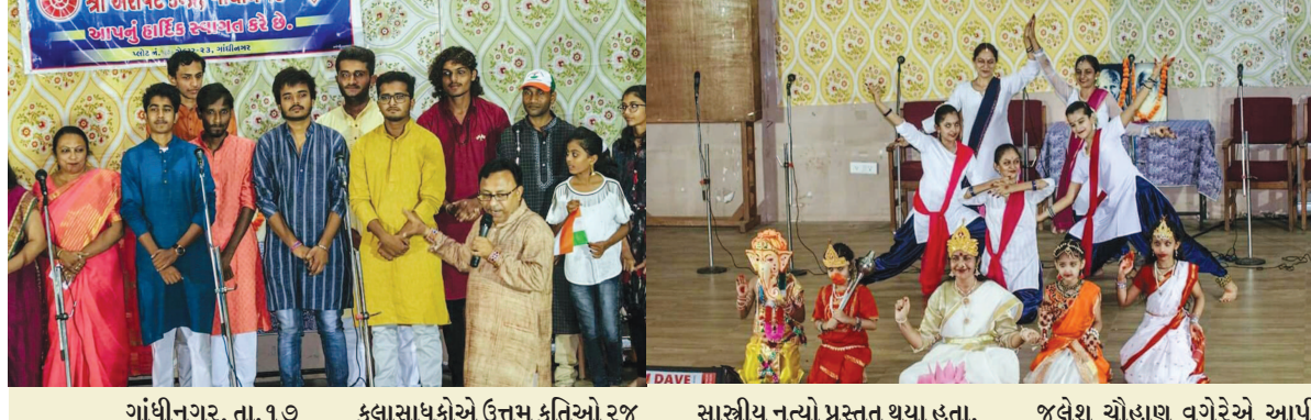
ગાંધીનગર, તા. ૧૭ અરવિંદ કેન્દ્ર દ્વારા મહર્ષિ અરવિંદની ૧૪૭મી જન્મજયંતિ પ્રસંગે પંદરમી ઓગસ્ટે આંબેડકર ભવન ખાતે રંગારંગ કાર્યક્રમ આયોજિત કરવામાં આવ્યો હતો.