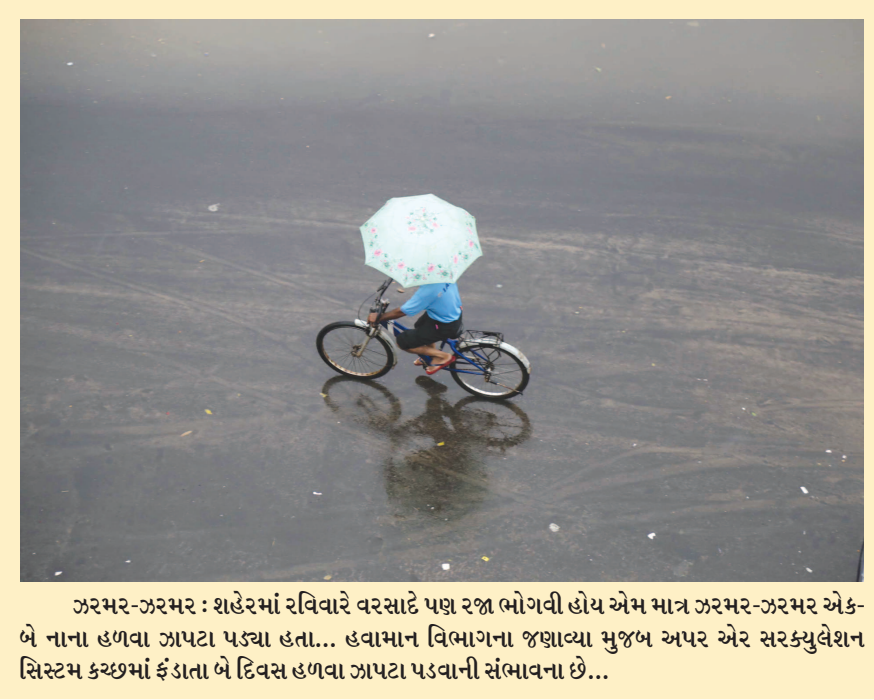
ઝરમર-ઝરમર : શહેરમાં રવિવારે વરસાદે પણ રજા ભોગવી હોય એમ માન ઝરમર-ઝરમર એક-બે નાના હળવા ઝાપટા પડ્યા હતા... હવામાન વિભાગના જણાવ્યા મુજબ અપર એર સરક્યુલેશન સિસ્ટમ કચ્છમાં ફંડાતા બે દિવસ હળવા ઝાપટા પડવાની સંભાવના છે...

માત્ર ગાંધીનગર જિલ્લાની આપણે વાત કરીએ તો શહેરી વિસ્તારમાં ધાતુના પતરાથી ઘર ઢંકાયેલું હોય એની સંખ્યા ઓછી છે પરંતુ ગ્રામીણ ગાંધીનગરમાં એ સંખ્યા ખૂબજ વધુ છે. આંકડાઓને આપણે વિશ્લેષણ સાથે સમજીએ તો એમ કહી શકાય કે ગાંધીનગર ગ્રામીણ વિસ્તારના ઘર સો પરિવારોએ ૪૩ પરિવારો અને ગાંધીનગર શહેર વિસ્તારના ઘર સો પરિવારોએ ૨૫ પરિવારો ઈંટ, કોન્ક્રેટ કે