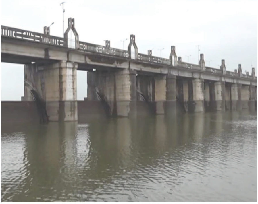
વાત્રક કેમમાં ૧૨૮૭૦ ક્યુસેક પાણીની આવક

ગુજરાતમાં મજબૂત લો-પ્રેસરના પગલે સાર્વત્રિક વરસાદ થવાની સાથે ભારેથી અતિભારે વરસાદની હવામાન વિભાગની આગાહી વચ્ચે અરવલ્લી જિલ્લામાં મેઘરાજાએ હેત વરસાવતા જિલ્લાના જળાશયોમાં નવા નીરની આવક થતા ભૂમિપુત્રો ખુશીથી ઝૂમી ઉઠ્યા છે.