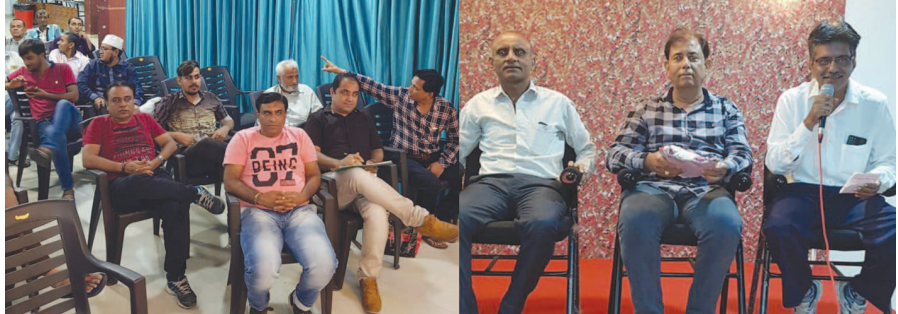
મોડાસા ફૂટવેર એસોસિએશનની જનરલ મિટિંગ હોટલ હનીના બ્લેકવેટ હોલમાં ગત રવિવારે યોજાઈ ગઈ. આ મીટિંગમાં ફૂટવેરના બંધને લગતી વિવિધ સમસ્યા તથા મુદ્દાઓની ચર્ચા કરવામાં આવી હતી.