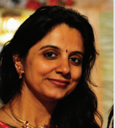
નૂપુર સોની લાયોન્સ ક્લબ