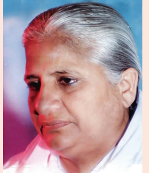
સિંધપ્રાન્તના હૈદરાબાદ ખાતે થયો હતો. આધ્યાત્મિક