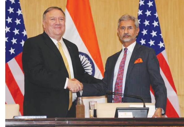
ટૂંક દ્વારા કાશ્મીરના મુદ્દા પર વિદેશ પ્રધાન આમને સામને મધ્યસ્થતા કરવા માટેની ઓફર આપ્યા હતા. બંને વિદેશ પ્રધાન

છે કે પોમ્પિયો સાથે શ્રેણીય મુદ્દા પર વિસ્તૃત વાતચીત થઈ છે. અમેરિકી સમક્ષ પોમ્પિયોને સાફ શબ્દોને કહી દેવામાં આવ્યું છે કે જો કાશ્મીર પર કોઈ વાતચીતની જરૂર પડશે તો માત્ર પાર્કિસ્ટાન સાથે થશે. આ વાતચીત પણ દ્વિપક્ષીય રહેશે. થોડાક દિવસ પહેલા પણ ટૂંક મધ્યસ્થતાની વાત કરીને હોબાળો મચાવ્યો હતો. ટૂંકાવ નિવેદન આપ્યા બાદ ભારતે ફરી એકવાર નારાજગી વ્યક્ત કરી હતી. ભારતે તેની પ્રતિક્રિયા આપતા કહ્યું હતું કે કાશ્મીર પર વિવાદ દ્વિપક્ષીય છે. તેમાં મધ્યસ્થી માટે કોઈ જગ્યા નથી. ટૂંક પહેલા જ્યારે મધ્યસ્થીની વાત કરી ત્યારે તેમની વ્યાપક ટિકા થઈ હતી.