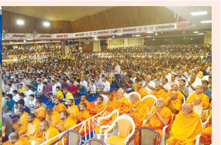
પૂજ્ય મહંત સ્વામીના આશીર્વાચન - ગાંધીનગર અક્ષરધામ ખાતે છેલ્લા ચાર દિવસથી પૂજ્ય મહંત સ્વામી પધાર્યા છે... વહેલી પ્રભાતથી મોડી સાંજ સુધી અસંખ્ય ભાવિકોને દર્શન લાભ આપીને આશીર્વાચન પાઠવે છે... રવિવારે સાંજે પરંપરાગત યોજાતી રવિસભામાં પૂજ્ય મહંત સ્વામીએ ઉપસ્થિત રહી સેંકડો ભાવિકોને સદાચારનો સંદેશ પાઠવ્યો હતો... પૂજ્ય મહંત સ્વામીના દર્શન અને આશીર્વાદનો લાભ લેવા ભાવિકોમાં પડાપડી સર્જાઈ હતી...