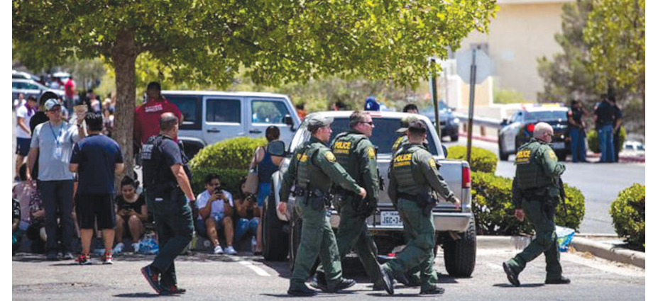
બળભાગટ મચી ગયો છે. ટેક્સાસ અને ઓહિયોમાં ગોળીબારની આ ઘટના બની છે. ટેક્સાસમાં શોપિંગ મોલમાં અંધાધૂંધ ગોળીબારની ઘટના બન્યા બાદ વધુ એક ઘટના પણ સપાટી ઉપર આવી હતી. ઓહિયોમાં એક શખ્સે નવથી વધુ લોકોને મોતને ઘાટ ઉતારી દીધા

એક મોલમાં ગોળીબાર કરવામાં આવ્યો હતો. અંધાધૂંધ ગોળીબારમાં ૨૦થી વધુ લોકોના મોત થયા હતા જ્યારે ૨૬થી વધુ લોકો ઘાયલ થયા હતા. બપોરના ગાળામાં ૧.૩૦ વાગ્યાની આસપાસ ઓરેગન જિલ્લામાં આ ઘટના બની હતી.