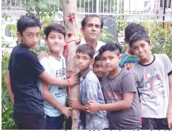
સંસ્કાર શુભના બાળકો દ્વારા વૃક્ષોને ફ્રેન્ડશીપ ડે બાંધીને અનોખી રીતે ઉજવણી કરવામાં આવી હતી.