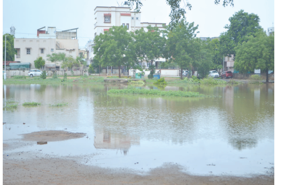
માટી પુરાણ ન થતા સેક્ટરોમાં માર્ગોની આસપાસ માટીપોલાણ ધરાશાયી થતા માર્ગ વચ્ચે આડશ સર્જાઈ હતી. ત્રણ ઈંચ વરસાદમાં છતાં કુડાસણ અને સરગાસણ શહેરના સેક્ટરો ઘમરોળાતા વૃક્ષો ધરાશાયી થવાની સાથે માર્ગો પર થતા મોટા ગાબડા અસ્તિત્વમાં આવ્યા હતા. સે-૨ માં પણ વૃક્ષ યોકડી પાસે માર્ગો આસપાસ અનુસંદાન પાન-૭ પર

ઘરાશાયી થઈ ગયા હતા. જ્યારે માટી પોલાણના લીધે વાહનો પણ ફસાઈ પડ્યા હતા. રાત્રિના સમયે ધોધમાર વરસાદ વરસવાનું શરૂ થતા મોસમનો નઝારો બદલાઈ ગયો હતો. સેક્ટરોના આંતરિક માર્ગો સહીત સેક્ટરોના કોમન પ્લોટમાં જળબંબાકાની સ્થિતિ સર્જાઈ હતી. વિલંબના અંતે પધારેલા મોંઘેરા મેઘરાજીના આગમનથી જનજીવન ખુશહાલ બન્યું હતું. નગરજનોએ વરસાદમાં ભીંજવાની મજા માણી હતી. ચોમાસાની સિઝનનો અત્યાર સુધી પ્રથમવાર ૩ ઈંચ જેટલો વરસાદ વરસતા સાર્વત્રિક ઠંડક પ્રસરી હતી. વરસાદના લીધે જનજીવન પ્રભાવિત થયું હતું. ધોધમાર વરસાદના લીધે દિવસી વાહનચાલકો માર્ગો પર અટવાયા હતા. સેક્ટરોમાં કેટલાક ઠેકાણે સ્ટ્રીટ લાઈટો ડુલ થતા અંધારુ છવાયું હતું. જ્યારે સ્ટોર્સમાં વોટર લાઈનની કામગીરીના અંતે યોગ્ય