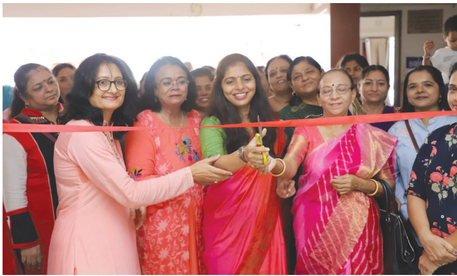
પિટી વિમેન ક્લબ દ્વારા મહિલા સશક્તિકરણ પબવાડિયાની ઉજવણી નિમિત્તે એક્ટિવિશન કમ સેલનું આયોજન બીજી અને ત્રીજી ઓગષ્ટના રોજ ઉમિયા મંદિર સંસ્થાન ખાતે કરવામાં આવ્યું હતું. ગાંધીનગર મહાનગરપાલિકાનાં મેયર રીટાબેન પટેલના હસ્તે આ એક્ટિવિશન ખુલ્લું મૂકવામાં આવ્યું હતું. આ એક્ટિવિશનમાં બહેનો દ્વારા જાતે જ બનાવવામાં આવેલી રાખડી, રંગોળી, ડ્રેસ, જ્વેલરી, હેર ઓઈલ, નાસ્તા, અથાણાં, મસાલાનું વેચાણ કરવામાં આવ્યું હતું. ઉદ્યોગ સાહસિક મહિલાઓને આ એક્ટિવિશનના માધ્યમથી કલબે એક ઉપયોગી પ્લેટફોર્મ પૂરું પાડ્યું હતું.