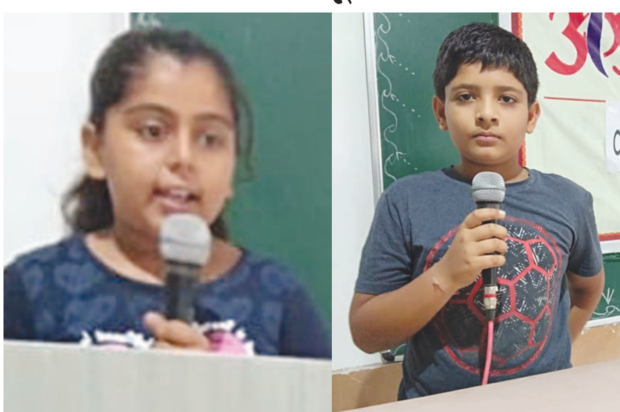
બાળકોમાં લેખન કૌશલ્યનો વિકાસ થાય અને સ્ટેજ પર રજૂઆત કરવાનો એમનો ડર થાય તે માટે તેમને શાળાકક્ષાએ જ અલગ-અલગ કાર્યક્રમોમાં ભાગ લેવાડાવવાના ઉપક્રમ રૂપે ઓમકાર ઈન્ટરનેશનલ સ્કૂલ દ્વારા ધોરણ-૭થી ૮ના વિદ્યાર્થીઓ માટે વાર્તાકથન સ્પર્ધાનું આયોજન કરવામાં આવ્યું હતું. પ્રથમ ત્રણ વિજેતાઓને શાળા પરિવાર તરફથી પ્રમાણપત્રો એનાયત કરવામાં આવ્યાં હતાં.