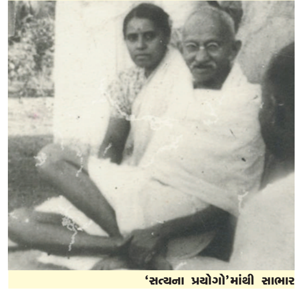
'સત્યના પ્રયોગો'માંથી સાભાર

પ્રયોગનું પરિણામ ખરાબ આવ્યું એમ ન કહી શકાય. મારા દીકરાઓને તેથી કંઈ નુકસાન થયું એમ હું નથી માનતો. લાભ થયો એ હું જોઈ શક્યો. તેમનામાં મોટાઈનો કંઈ અંશ રહ્યો હોય તો તે સર્વથા ગયો. તેઓ બધાની સાથે ભળતા શીખ્યા. તેઓ તવાયા. આ અને આવા અનુભવો પરથી મને એમ લાગ્યું છે કે, માબાપોની દેખરેખ બરાબર હોય તો પોતાનાં સારાંનદારાં છોકરાં સાથે રહે ને ભણે તેથી સારાને કશી હાનિ નથી. પોતાનાં છોકરાંને તિજોરીમાં પૂરી દેવાથી તે શુદ્ધ જ રહે છે અને બહાર કાઢ્યાથી અભડાય છે એવો કોઈ નિયમ તો નથી જ. હા, આટલું ખરું છે કે, જ્યાં અનેક પ્રકારનાં બાળકો તેમ જ બાળાઓ સાથે રહેતાં ભણતાં હોય ત્યાં માબાપની અને શિક્ષકની કસોટી થાય છે, તેમને સાવધાન રહેવું પડે છે.