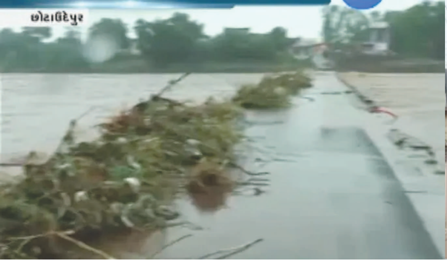
હવામાન વિભાગે ભારેથી અતિભારે વરસાદની ચેતવણી અકબંધ રાખી છે. પંચમહાલ, છોટાઉદેપુર, દાહોદમાં હજુ પણ અતિભારે વરસાદ પડવાની ચેતવણી અપાઈ

દાહોદના જુદા જુદા વિસ્તારોમાં પણ અતિભારે વરસાદ પડ્યો છે. હવામાન વિભાગે આગામી પાંચ દિવસ ગુજરાતમાં ભારેથી સિસ્ટમ સક્રિય થતા વાતાવરણમાં એલર્ટના આદેશો જારી કરી દીધા છે. હવામાન વિભાગના જણાવ્યા છે. આ વરસાદી સિસ્ટમથી વરસાદ પડવાની શક્યતા છે. તો આવતીકાલે અમદાવાદ સહિતના સહિતના વિસ્તારોમાં પણ ભારેથી અતિ ભારે વરસાદની આગાહી કરવામાં આવી છે. તો તા. ૧૦મીએ સમગ્ર સૌરાષ્ટ્રમાં પણ ભારે વરસાદની આગાહી કરાઈ છે. બીજા તરફ પૂર્વગત જિલ્લાઓમાં અથવા કામગીરી માટે એનટીઆરએફની ૧૦ટીમો સ્ટેન્ડ બાય કરવામાં આવી છે. દરમિયાન ગુજરાતમાં ગત વર્ષની સરખામણીમાં સીઝનનો સરેરાશ ૬૩.૩૮ ટકા વરસાદ નોંધાયો છે. છેલ્લા ૨૪ કલાકમાં ૨૨ જિલ્લાઓના ૮૪ તાલુકામાં ઘણો વરસાદ નોંધાયો છે. જેમાં સૌથી વધુ છોટાઉદેપુરના કવાંટમાં ૧૦ ઈંચથી વધુ વરસાદ નોંધાયો છે. આજે સવારે ૬ વાગ્યેથી ૧૦ વાગ્યા સુધીમાં લીમખેડામાં ૪૦મિમી, કવાંટમાં ૩૨મિમી, છોટાઉદેપુરમાં ૨૮મિમી, ધાનપુરમાં ૨૮મિમી, ગોધરામાં ૨૭મિમી અને દેવગઢ બારિયામાં ૨૪મિમી વરસાદ નોંધાયો છે.