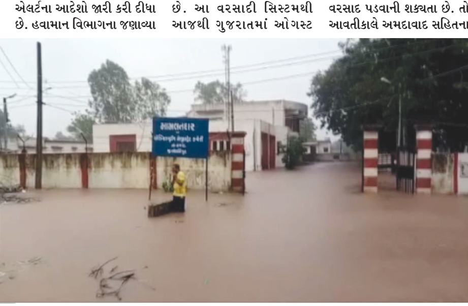
આગાહીના પગલે તંત્ર દ્વારા એનટીઆરએફની ૧૭ ટીમો અલગ-અલગ વિસ્તારોમાં તહેનાત કરવામાં આવી છે. તો, વડોદરામાં પણ જિલ્લા વહીવટી તંત્રએ પ્રમાણે, દક્ષિણ ગુજરાત તેમજ બંગાળની ખાડીના ઉત્તર-પશ્ચિમ, દક્ષિણ છત્તીસગઢ અને દક્ષિણ ઓરિશામાં સાર્થકલૌનિક સકર્ણવેશન સિસ્ટમ સક્રિય બની

મહિનામાં વરસાદનો બીજો રાઉન્ડ શરૂ થવાનો છે. આજથી આગામી પાંચ દિવસ સુધી દક્ષિણ ગુજરાત અને મધ્ય ગુજરાત સહિત રાજ્યભરમાં ભારેથી અતિભારે