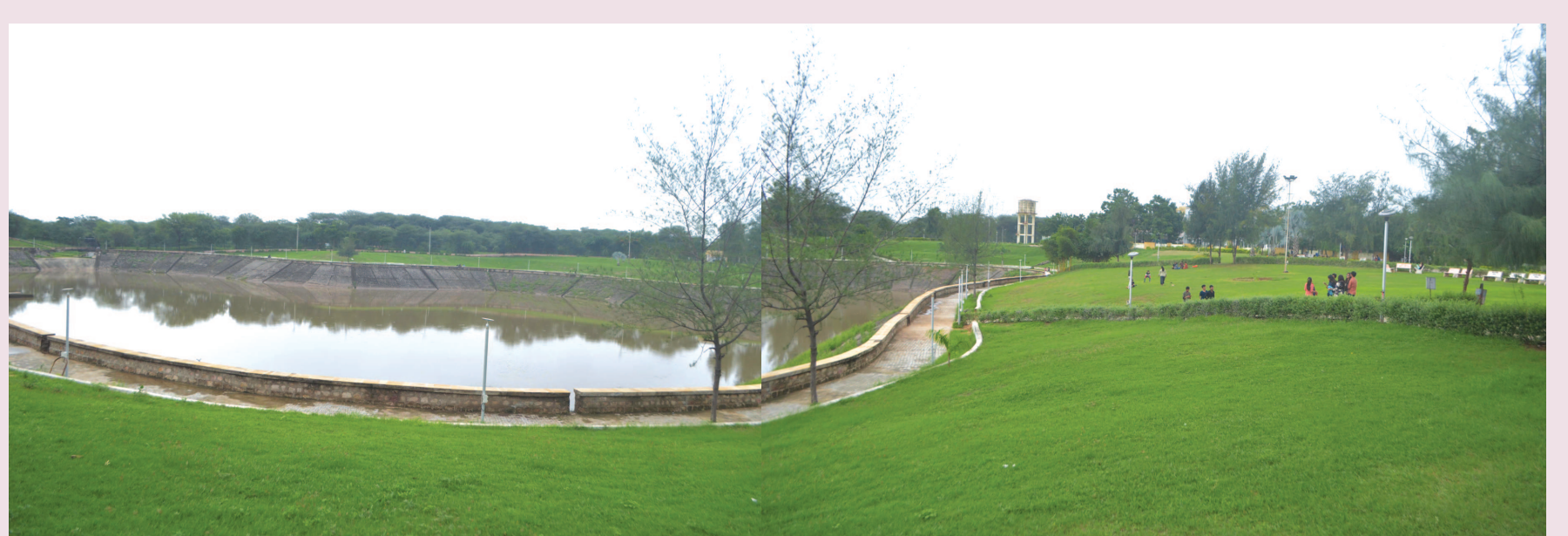
શહેરમાં વરસાદના લીધે હરિયાળી નિખરી છે. નગરના મુખ્યમાર્ગો સહીત સેક્ટરોમાં માર્ગોની આજુબાજુ પણ હરિયાળુ ઘાસ ઉગી નિકળ્યું છે. ત્યારે વર્ષ દરમિયાન ખાલીખમ રહેતું સે-૧ નુ તળાવ પણ વરસાદના લીધે ઉભરાયું છે. સે-૧ નુ તળાવ ભરાતા સહેલાણીઓમાં પણ આકર્ષણ છવાયું છે. સેક્ટરના આ તળાવ વિકાસની યોજના સાકાર થઈ નથી. તળાવના તળિયાની તરસ ન છીપાતા વર્ષ દરમિયાન હરિયાળા બગીચા વચ્ચે નિર્માણ કરાયેલા આ તળાવમાં સુકારો જોવા મળે છે. જ્યારે વરસાદે મોસમનો મિજાજ બદલી નાંખ્યો છે. ત્યારે તળાવની રોનક પણ નિખરી છે.