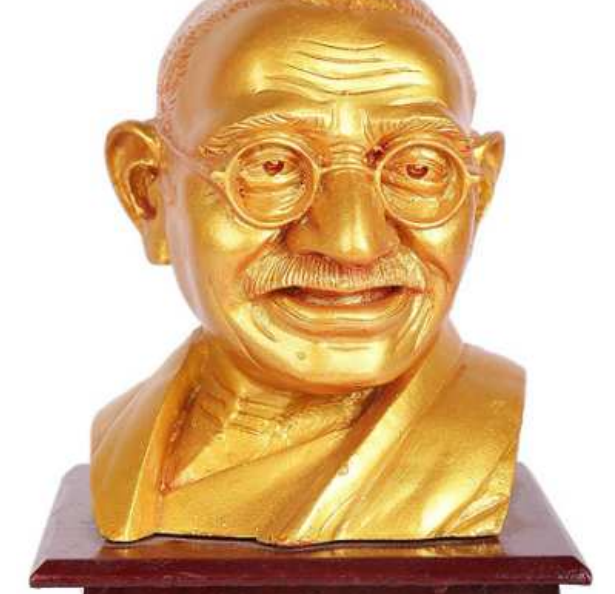
‘સત્યના પ્રયોગો’માંથી સાભાર