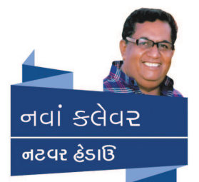
નાવં કહેવર નટવર હેડાઈ