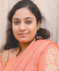
વિભૂતિબા ઇન્ટરિયર ડિઝાઇનર